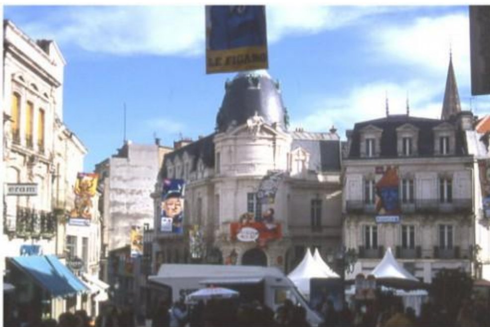
Photo d'ambiance dans les rues piétonnes d'Angoulême au moment du festival

Cet article est un retour sur la journée organisée par les Entretiens Jacques Cartier, autour du festival de BD. Il ne s'agit ici pas véritablement d'évoquer la BD mais de son développement concret et de son application dans la ville. Depuis quelques décennies maintenant, la BD a connu un développement grandissant, qu'expliquent de nombreux facteurs parmi lesquels la reconnaissance d'une légitimité artistique, la mise en place d'une panthéon de classiques, la structuration d'un réseau mêlant acteurs de l'édition, de la diffusion et de la création, l'émergence de mouvements syndicaux d'auteurs mais aussi l'implantation et la multiplication de festivals de BD un peu partout en France. Il n'est pratiquement plus une grande ville ou une ville moyenne qui ne soit pourvue de son festival de BD. Certains sont mondialement et nationalement connus : Angoulême, le plus prestigieux, ayant dépassé ses prédécesseurs (comme celui de Lucques en Italie) ; Quai des Bulles, qui s'est implanté durablement à Saint-Malo ou encore BD Boum à Blois, le plus grand festival gratuit.