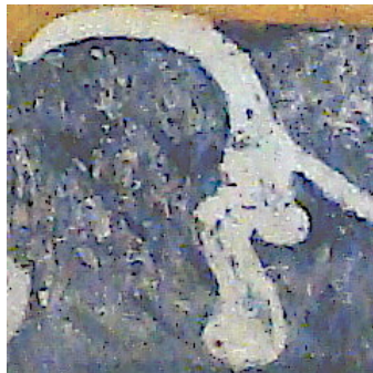
Fig. 2. Château de Montaigne, détail, ibid.

Ce déploiement en aile de chauve-souris, Henri Zerner le voit comme une couronne de perles à l'envers (il y en avait peut-être dans les quatre coins). De façon à peine plus claire, on distingue dans le rinceau un masque discret, autant médiéval (on en trouve de tels dans les enluminures), que maniériste. On ne devine pas de pendant symétrique à ce masque (Fig. 2).