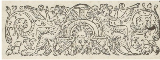
Figure 4. Edition de la Ménagerie de Xénophon, traduite par La Boétie, Paris, Guillaume Chaudière, 1571. Numérisation Gallica (exemplaire ayant appartenu à Montaigne, BnF, collection Payen, voir le projet MONLOE ).

Dans l'édition des Essais de 1588, le bandeau situé au-dessus de la préface « Au lecteur », offre une ornementation riche en caprices à l'antique et en « corps monstrueux » (Fig. 5) :