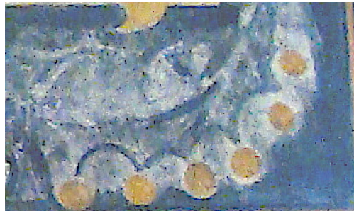
Fig. 1. Château de Montaigne, cabinet, décor au-dessus de la porte (détail).

Le dessus de porte contenant la célèbre inscription de la « retraite au sein des doctes muses » est encadré d'un décor étrange : en bas à droite, une forme indéfinissable, peut-être repeinte avec ses points orange, et dont l'identification varie d'un spectateur à l'autre, s'apparentant ainsi à un test de Rorschach (Fig. 1).