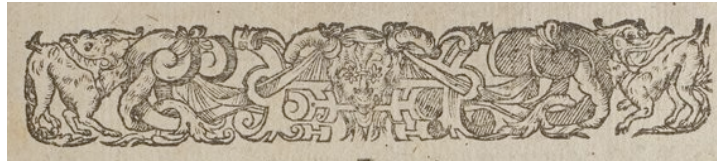
Figure 5. Essais , Paris, Abel L'Angelier, 1588. Exemplaire de la Bibliothèque Municipale de Bordeaux (EB), à ij r°.

Dans l'édition des Essais de 1588, le bandeau situé au-dessus de la préface « Au lecteur », offre une ornementation riche en caprices à l'antique et en « corps monstrueux » (Fig. 5) :