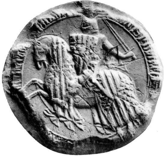
Fig. 1. Sceau de l'infant Pierre, 1356 (SAGARRA, 1916, LXVIII, 197).