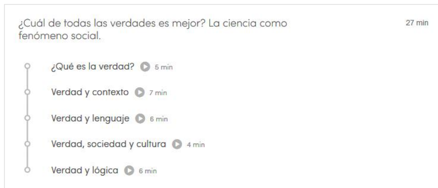
Figura 4. Consulta de un módulo en el portal Coursera (2015-04-22)