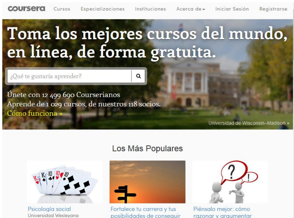
Figura 3. Página de inicio del portal Coursera (2015-04-22)

Se mostrará sobre un caso concreto cuál es el diseño accesible propuesto por el enfoque centrado en el contenido y cuáles son los aportes que puede hacer el enfoque comunicacional. El portal Coursera (Coursera Inc., 2015) es un portal que ofrece cursos MOOC de instituciones de todo el mundo. La estrategia de comunicación en la página de inicio (Figura 3) busca persuadir al público objetivo insistiendo sobre la calidad de los cursos, su facilidad de acceso y su gratuidad. El título "Toma los mejores cursos del mundo [...] se impone sobre los demás componentes de la interfaz gracias a su diseño visual: el fondo oscuro contrasta fuertemente con el color del texto y el tamaño de tipografía es el más grande de la página. Evidentemente este título capta la atención de una persona que puede percibir el diseño visual.