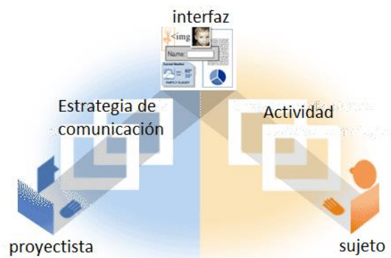
Figura 2. Modelo del enfoque comunicacional

El proyectista tiene una estrategia de comunicación con respecto al público objetivo, es decir, una manera particular de organizar el diseño de la interfaz en vistas de alcanzar el proyecto que se propuso. En el ejemplo citado, el proyectista puede desear que el público tenga claros los objetivos del curso. Para ello ofrecerá, desde la página de inicio del curso, un video dónde se presenten los objetivos. La estrategia de comunicación posee entonces gran relevancia para el diseño de la interfaz y para la e-Accesibilidad ya que determina el estilo, la organización y la jerarquización de los componentes de la interfaz que hará el proyectista.