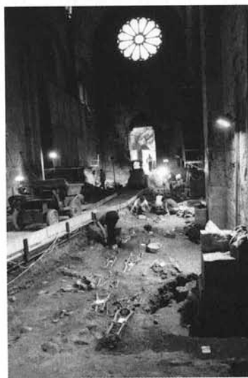
Fig. 5: Fouille des sépultures de la période moderne ménagées dans les stratigraphies supérieures de l'église Notre-Dame du Bourg à Digne (cl. Ville de Digne).

Les programmes de recherche sur la céramique, le verre, le métal et au-delà sur l'histoire des techniques et des sociétés artisanales, font appel à toutes les approches historiques et archéologiques traditionnelles, sources écrites et iconographie en premier lieu, mais aussi aux enquêtes ethnologiques et ethno-archéologiques conduites depuis plus de quarante ans maintenant dans une bonne partie du Bassin Méditerranéen. Les études de matériels, fondatrices de ces approches nouvelles, sont par ailleurs menées selon un protocole fondé sur la prise en compte des grandes séries et de la longue durée. Le corollaire de cette capitalisation des données est l'extension des recherches à la période moderne, voire contemporaine au titre primordial de la part de l'héritage, tant en Provence qu'en Languedoc, auquel Gabrielle Démiens d'Archimbaud est toujours restée très attachée.