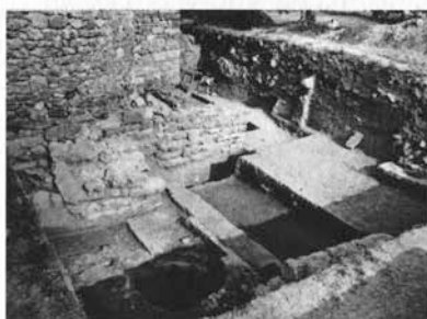
Fig. 2: Vue des fouilles au chevet de l'église de La Gayole.

Par ailleurs, il faut souligner l'attention accordée par Gabrielle Démiens d'Archimbaud à la définition d'un protocole méthodologique. La qualité des techniques de fouilles stratigraphiques et de l'enregistrement des données sur les chantiers qu'elle a dirigés est reconnue à l'échelle nationale, comme l'illustrent les diverses coupes stratigraphiques de La Gayole et de Saint-Victor publiées avec leurs commentaires dans le manuel d'archéologie de Michel de Boüard.