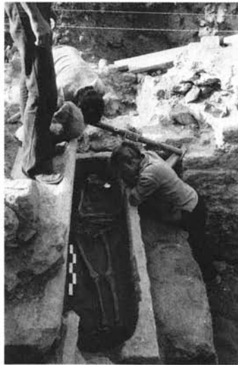
Fig. 1 : G. Démiens d'Archimbaud lors des fouilles de la Gayole (La Celle), en 1971

Pour Gabrielle Démiens d'Archimbaud, l'affirmation de l'archéologie s'exprime surtout par la mise en place et la direction de chantiers d'envergure. C'est cette conviction qui la guide et l'amène à choisir des sites emblématiques du Moyen Age, bien souvent occupés depuis l'Antiquité. De son activité de terrain, ressortent bien évidemment les fouilles exceptionnelles du village médiéval de Rougiers de 1961 à 1968, qui constitue le sujet d'un doctorat magistral 9 , mais aussi de la chapelle de La Gayole (Var) en 1964-1972, de l'abbaye de Saint-Victor de Marseille en 1970-1978, de l'oppidum de Saint-Blaise en 1980-1984 puis de la cathédrale Notre-Dame-du-Bourg à Digne de 1983 à 2004 10 .