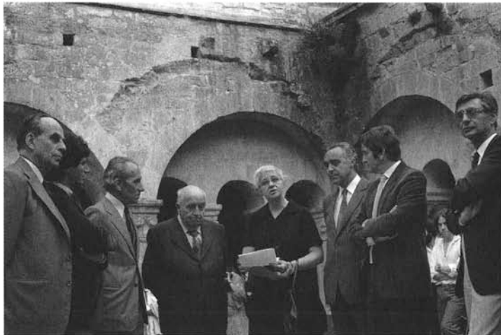
Fig. 7: Inauguration en 1981 de l'exposition « Aujourd'hui le Moyen Age » à l'abbaye de Sénanque en présence de Jack Lang, ministre de la Culture (cl. LA3M).

Dans le cadre des recherches céramologiques et à l'occasion du VI e congrès de l'AIECM2 tenu à Aix-en-Provence, elle a assuré en 1995 le commissariat scientifique de trois importantes expositions internationales et itinérantes: « Le Vert et le Brun, de Kairouan à Avignon, céramiques du X e au XV e siècle , Marseille La Vieille Charité » qui réalise la synthèse sur l'apparition des faïences en Méditerranée; « Petits Carrés d'Histoire, pavements et revêtements muraux dans le midi méditerranéen du Moyen Age à l'époque moderne », Avignon, Palais des papes, qui révèle toute la richesse sur une mode de revêtement en faïence et terre vernissée jusqu'alors peu connu pour la période médiévale et « Terres de Durance, céramiques de l'Antiquité aux temps modernes », Musée de Digne, qui met en lumière une zone de production importante depuis le Moyen Age, nouvellement documentée par les fouilles et le croisement avec les sources écrites et iconographiques.