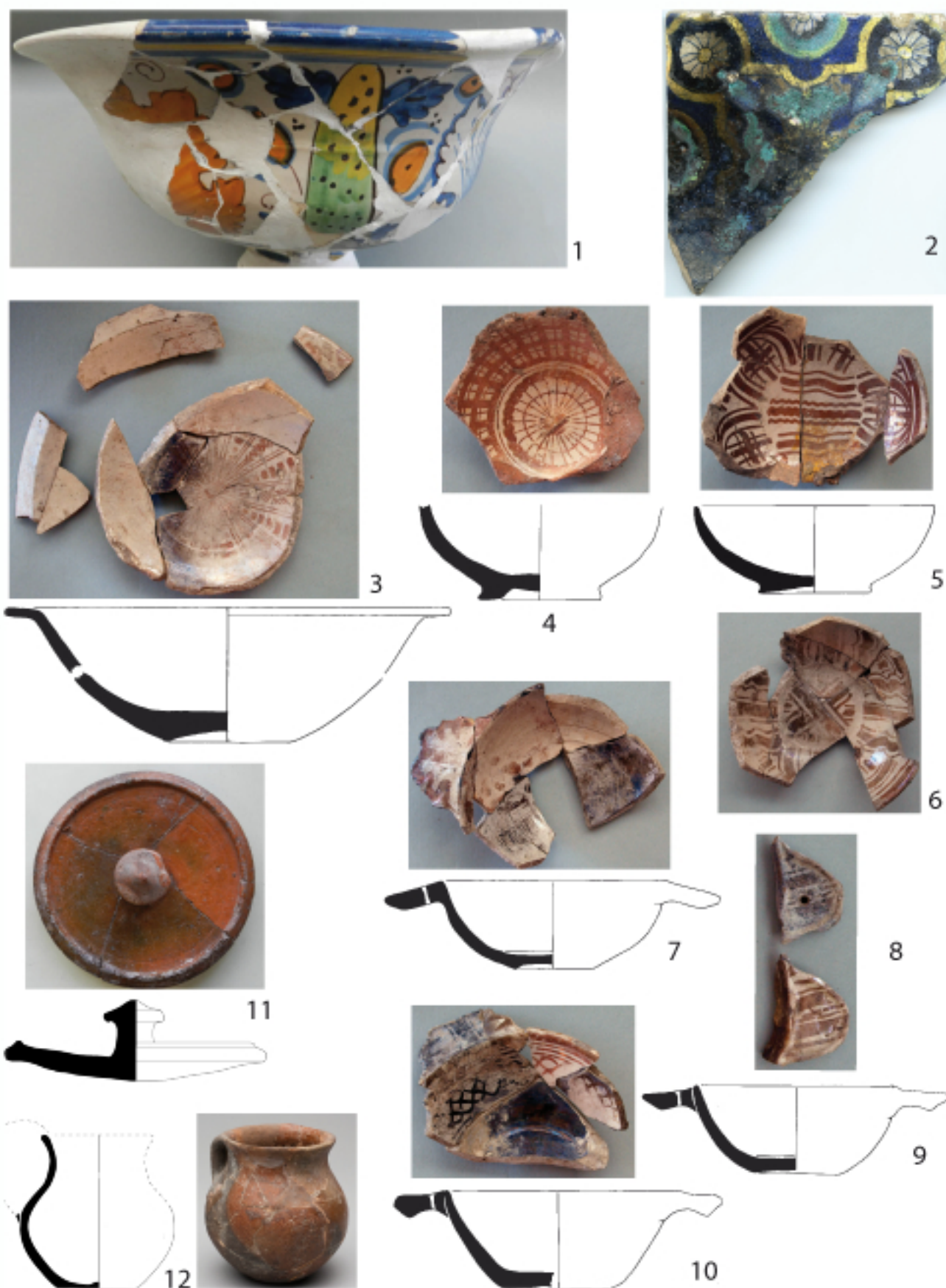
Fig.7 1, coupe de Montelupo ; 2, carreau catalan ; 3-4, coupe et écuelle de Valence ; 5-10 écuelles de Barcelone ; 11-12, culinaire de Barcelone (Dessins E. Bailly, L. Vallauri, Cl. LASM).