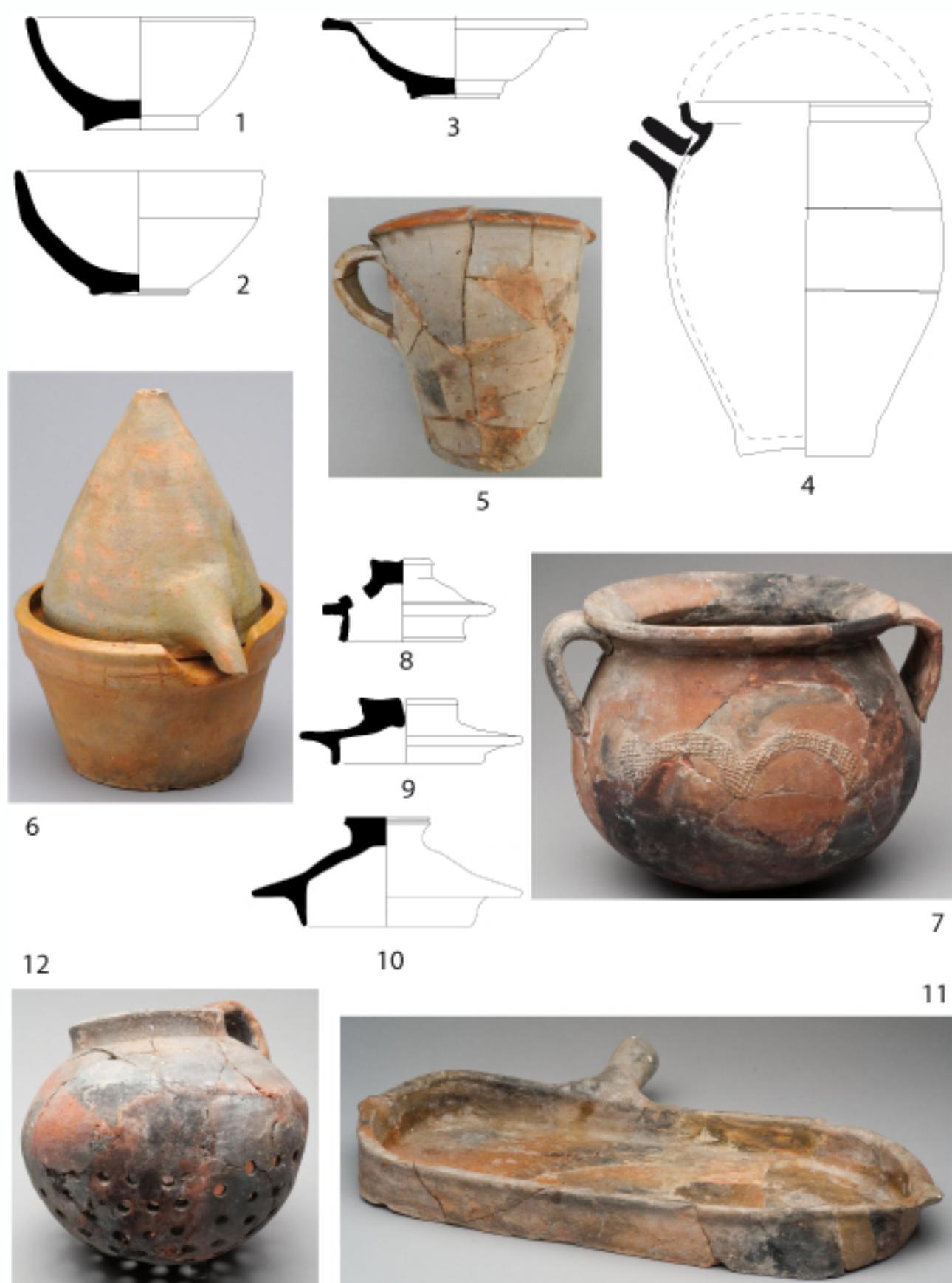
Fig.3 productions de l'arrière pays marseillais : 1 et 2, écuelles ; 3, coupelle ; 4, cruche ; 5, pot de chambre ; 6, alambic ; 7, marmite ; 8-10, couvercles ; 11, lèche-frîte ; 12 pot à châtaigne (Dessins E. Bailly).