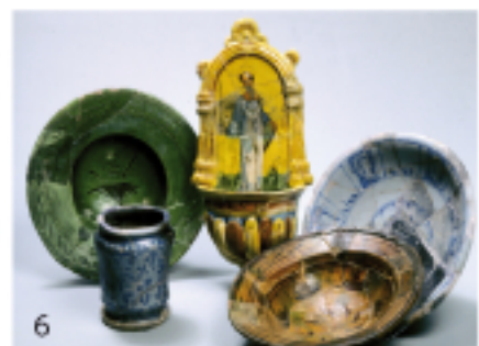
Fig.1 1, approvisionnement du château de Roquevaire ; 2, vaisselles de l'arrière pays ; 3, culinaire d'Ollières ; 4, vaisselles de Fréjus ; 5 et 6, vaisselles importées d'Italie et d'Espagne.