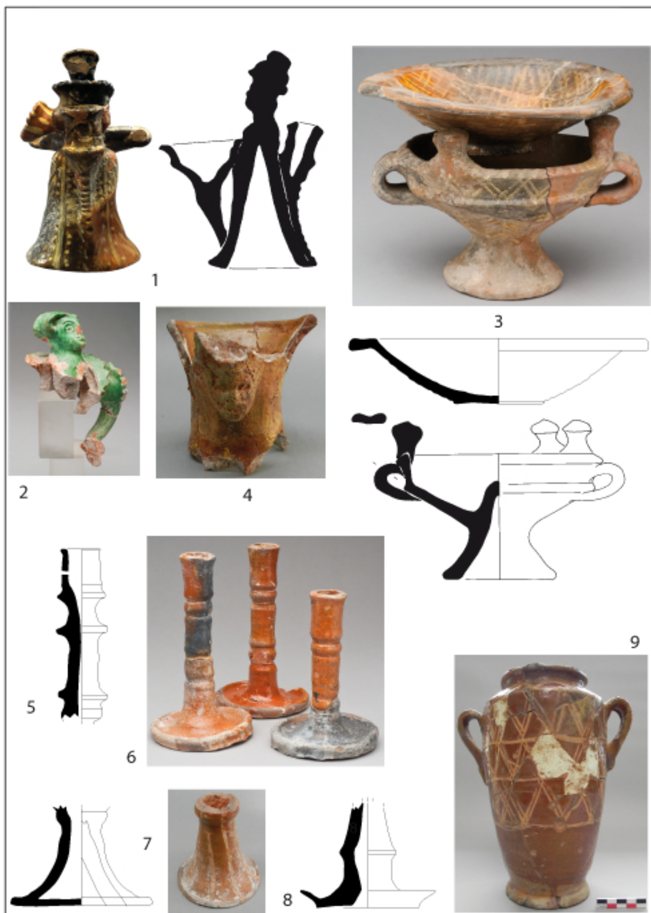
Fig.2 productions de l'arrière pays marseillais : 1 et 2, salières ; 3, réchauds ; 4, pichet ; 5-8, luminaire ; 9, pot à conserve (Dessins E. Bailly, L. Vallauri, CL LAM).