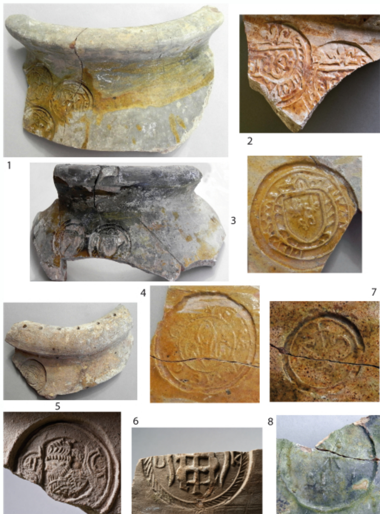
FigA 1-7, jarres aux tampons de Fréjus, 8, de Biot.