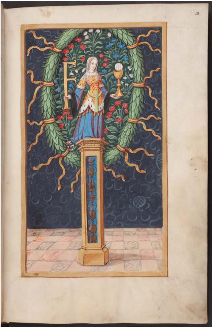
Fig. 1 : La Foi, Herzog August Bibliothek, Wolfenbüttel, Cod. Ex. 86.4, f°13.

Avant même d'entrer dans les limites de la cité, François put assister à une première histoire : sur la Saône, un navire tiré par un cerf blanc ailé transportant divers personnages (fig.2).