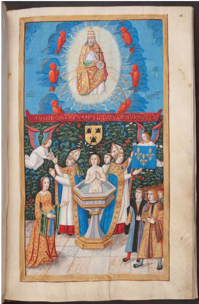
Fig. 4 : Le baptême de Clovis, Herzog August Bibliothek, Wolfenbüttel, Cod. Ex. 86.4, f°18r.