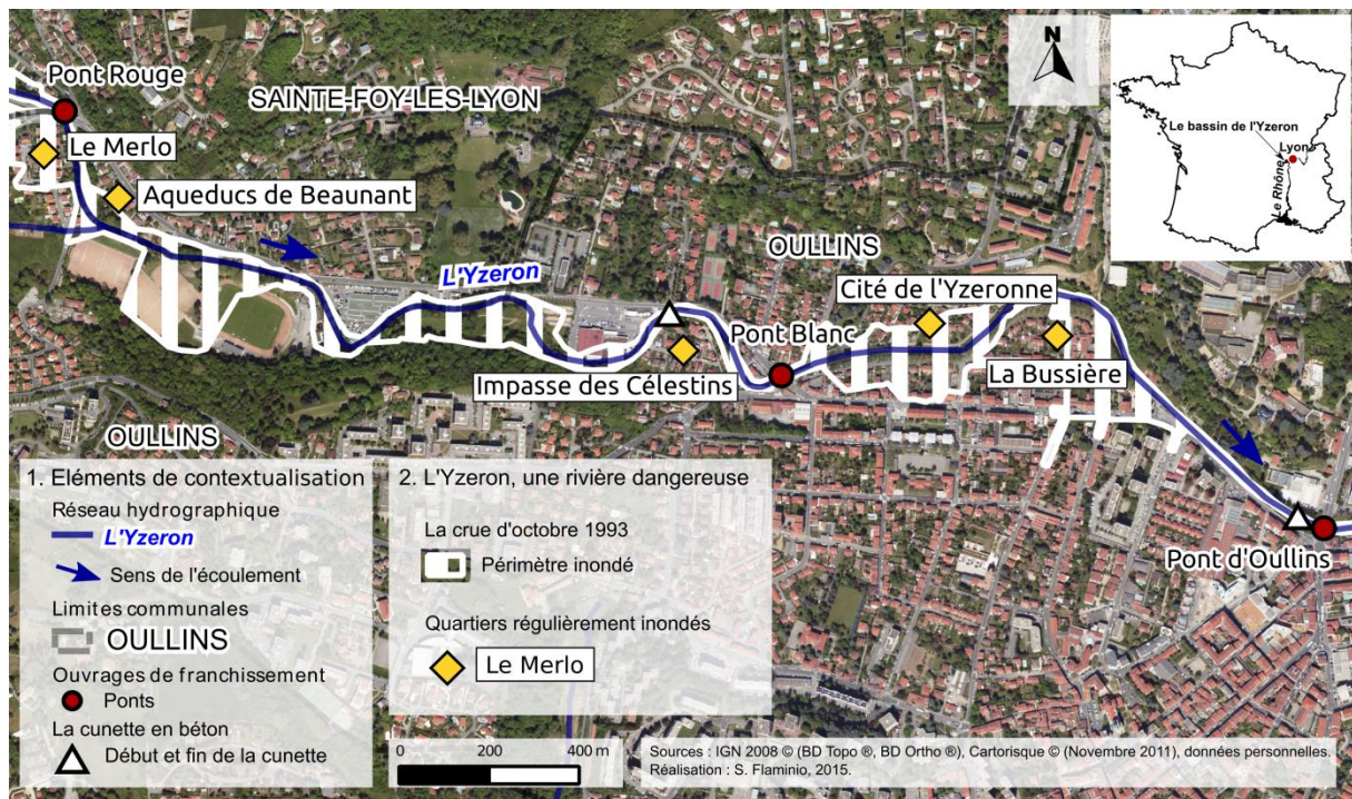
180 181 Figure 1. Carte de localisation de l'Yzeron, une petite rivière dangereuse dans un 182 environnement urbain dense.