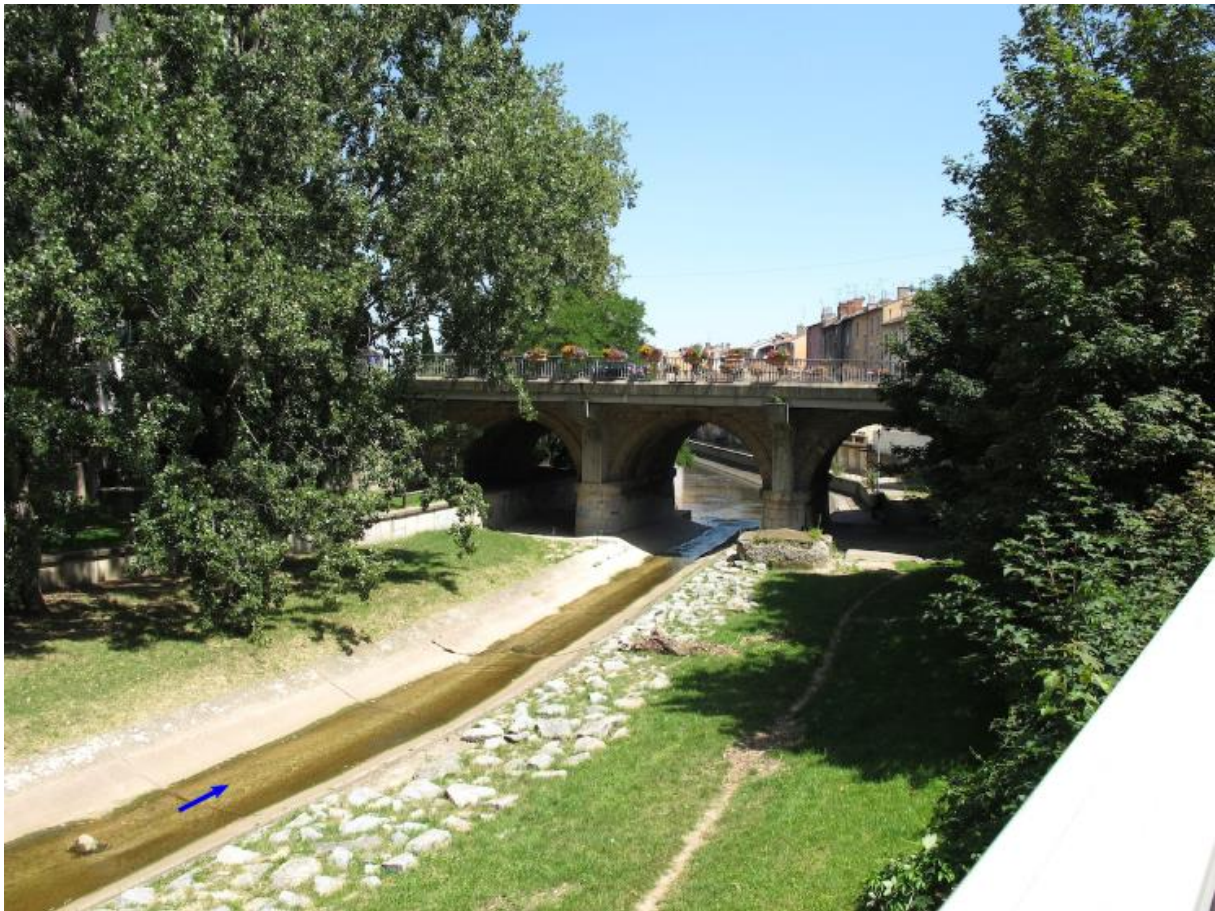
274 275 Figure 2b. L'Yzeron en 2013 au Pont d'Oullins.

276 The Yzeron River in 2013 at the Bridge of Oullins.