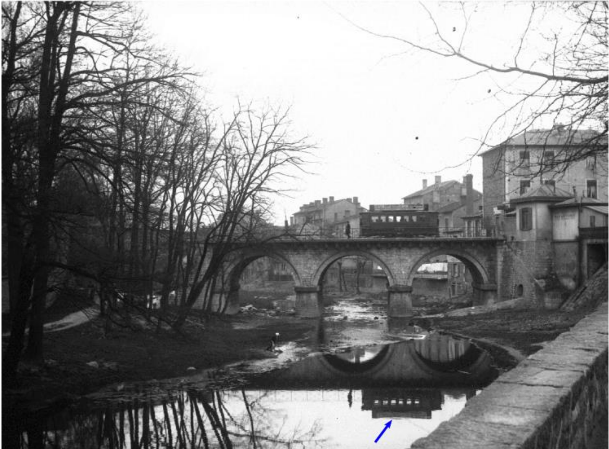
269 270 Figure 2a. L'Yzeron vers 1900 au Pont d'Oullins (Source : « Le Pont d'Oullins », auteur 271 inconnu, ca. 1900, Collections BML ©).

272 The Yzeron River around 1900 at the Bridge of Oullins (Source: “Le Pont d’Oullins”, 273 unknown author, ca. 1900, Collections BML ©).