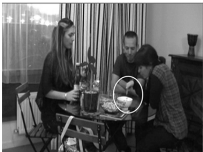
5. JUL pointe vers le bol et demande ce que c'est