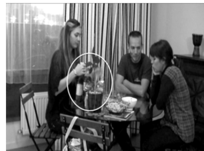
4. ANN approche la bouteille et pose le verre