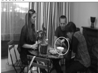
5. JUL pointe vers le bol et demande ce que c'est