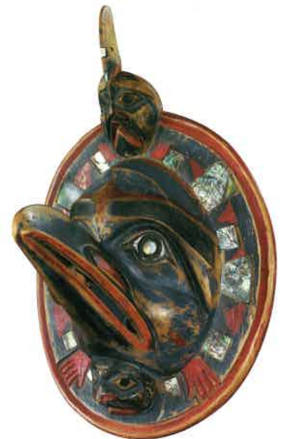
LOT 36, MASQUE AYANT APPARTENU À W. PAALLEN

A la fin des années 1930, deux peintres associés au cercle surréaliste vont se rendre en Colombie britannique et en Alaska. Il s'agit peut-être moins pour eux de découvrir un peuple que de collecter les derniers vestiges d'une riche culture sur le point de disparaître. En 1938, Kurt Seligmann (1900-1962) visite la région