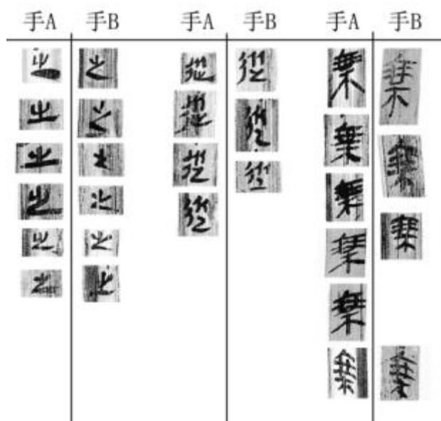
圖 2: 正文常用字比較