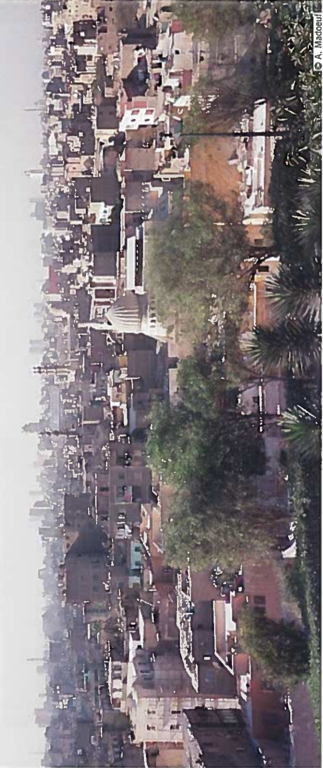
Vue du parc Al Azhar vers Le Caire