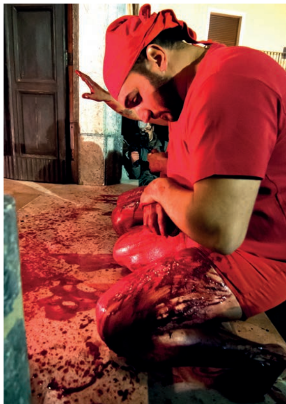
2. Battenti se flagellant sur le seuil de l'église.

Le premier examine des cérémonies, se déroulant plusieurs fois par an à Naples, qui impliquent la manipulation d'ampoules contenant du sang coagulé, dont la provenance est attribuée à la décapitation de Saint Janvier – sa tête serait quant à elle conservée dans un buste reliquaire. Lors du rapprochement rituel des ampoules avec ce buste, qui « re-présentifie l'événement fondateur » (p. 71), les participants espèrent que le sang retrouve son état liquide, ce qui est un signe de bienveillance de la part du saint. Selon l'historien Niola, cité par l'auteur : « Le sang, symbole de mort quand il est coagulé dans le reliquaire, change de signe au moment de la liquéfaction, devenant symbole de vie » (p. 71). En approfondissant l'analyse, D'Onofrio montre qu'il existe un lien entre la périodicité du miracle et le sang menstruel, faisant de Saint