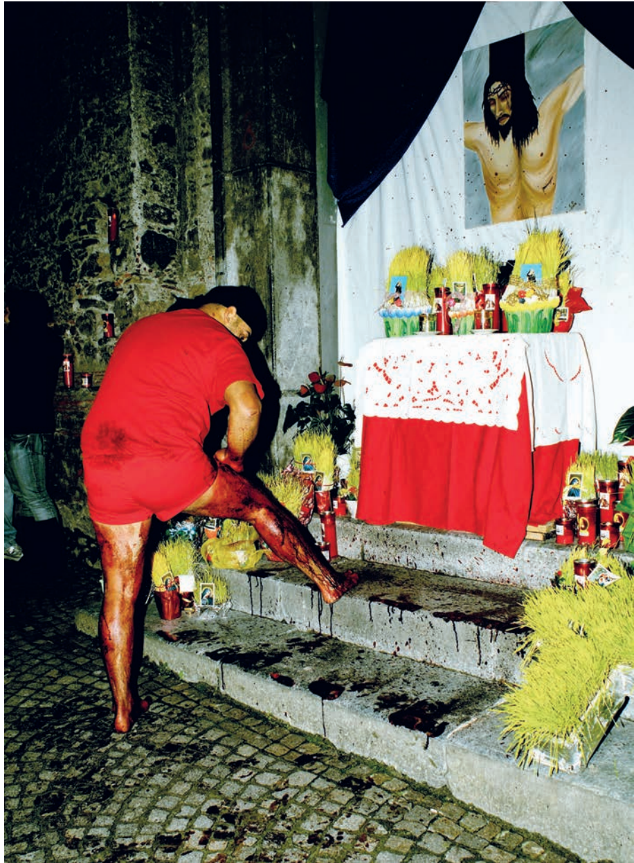
3. Devant les lavurieddi (Jardins d'Adonis).