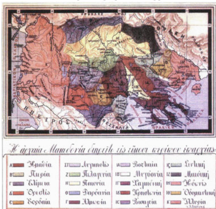
Carte (1) : La Macédoine antique à l'époque de Philippe II, Petroff (1903)©

Si la discussion autour de l'espace et de la géographie de la région pendant les focus groups n'a pas été stimulée par le biais d'un support iconique, deux cartes géographiques ont été utilisées à la fin de la première partie des entretiens individuels qui nous ont permis de confronter le discours des interviewés à partir d'indicateurs cartographiques objectifs 18 .