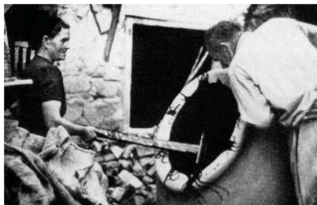
Fig. 5 : Poissage de jarre à Chypre au XX e siècle (d'après Demetriou, 2001 : 26)

fabrication du pitharin sur l'épaule (Ionas 2000 : 100-103). Après une phase de séchage, les jarres étaient roulées jusqu'au four. Sur l'île de Chypre, les fours pour la cuisson des pitharia étaient rudimentaires (Hampe, Winter 1962 : 69, fig. 41). Une construction grossière en dôme avec un tirage vertical, dont les dimensions variaient suivant la production, pouvait contenir plusieurs jarres placées sur des briques et calées avec des tuiles – le four détruit à Phini en 1993 pouvait contenir six jarres. Il n'y avait pas de foyer, le feu était mis aux branches de pin, de chênes et aux sarments de vigne directement placés entre les jarres et les autres types de pots mis à cuire ensemble. La quantité de bois nécessaire pour une cuisson qui durait environ trois jours est estimée entre 609 et 812 kg. Lorsque les jarres pour le vin devaient être poissées, elles étaient sorties du four avant leur complet refroidissement, la poix pénétrant mieux lorsque les pores des parois étaient dilatées sous l'effet de la chaleur – une pratique déjà mentionnée dans les Géoponiques . Le poissage des jarres aussitôt après