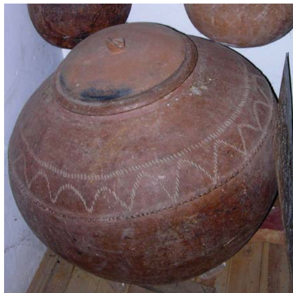
Fig. 4 : Jarre et son couvercle de terre, Chypre

fabrication du pitharin sur l'épaule (Ionas 2000 : 100-103). Après une phase de séchage, les jarres étaient roulées jusqu'au four. Sur l'île de Chypre, les fours pour la cuisson des pitharia étaient rudimentaires (Hampe, Winter 1962 : 69, fig. 41). Une construction grossière en dôme avec un tirage vertical, dont les dimensions variaient suivant la production, pouvait contenir plusieurs jarres placées sur des briques et calées avec des tuiles – le four détruit à Phini en 1993 pouvait contenir six jarres. Il n'y avait pas de foyer, le feu était mis aux branches de pin, de chênes et aux sarments de vigne directement placés entre les jarres et les autres types de pots mis à cuire ensemble. La quantité de bois nécessaire pour une cuisson qui durait environ trois jours est estimée entre 609 et 812 kg. Lorsque les jarres pour le vin devaient être poissées, elles étaient sorties du four avant leur complet refroidissement, la poix pénétrant mieux lorsque les pores des parois étaient dilatées sous l'effet de la chaleur – une pratique déjà mentionnée dans les Géoponiques . Le poissage des jarres aussitôt après