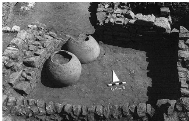
Fig. 2 : Vestiges de pithoi à Pergame (d'après Rheidt 1990 : pl. 1.1)