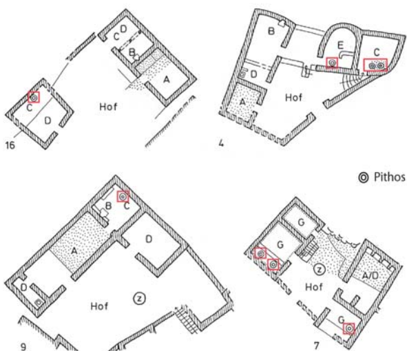
Fig. 1 : Localisation des pithoi dans les maisons de Pergame au XIII e siècle (d'après Rheidt 1990 : fig. 9)

Les pithoi étaient moins fréquents en ville dans lesquelles les facilités d'approvisionnement ne justifiaient pas de recourir à de gros volumes de stockage (Oikonomides 1990 : 211). Il est normal en effet que ces contenants, nombreux en contexte de production dans un cadre rural, aient été plus rares dans un contexte de consommation urbaine. Cependant, il ne faut pas mésestimer la nécessité de stockage des