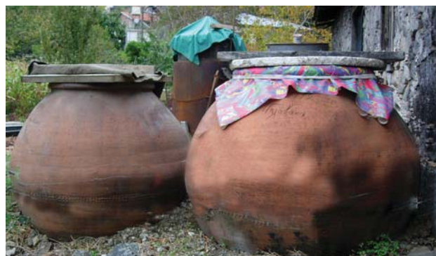
Fig. 8 : Pitharia avec la date inscrite de 1972 sur l'épaule encore en usage dans le Troodos