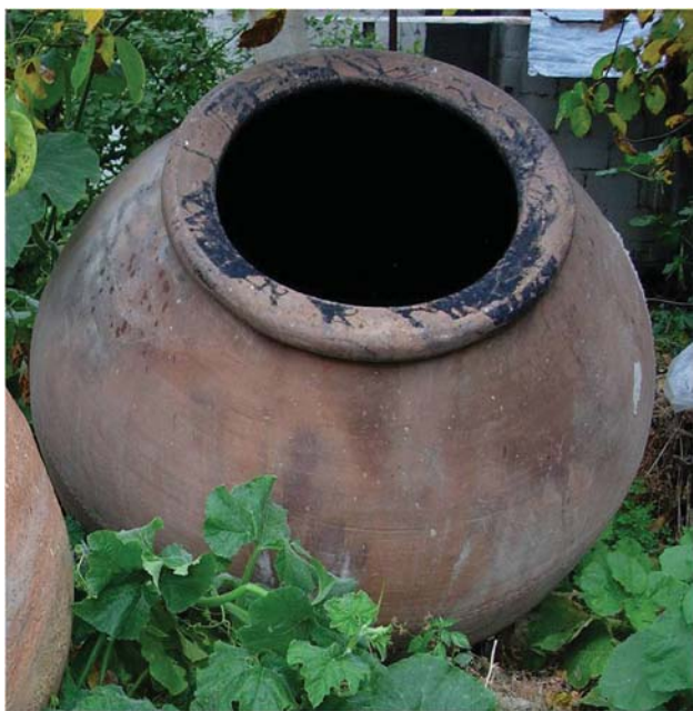
Fig. 6 : Jarre poissée, Chypre XIX e siècle

la cuisson est déjà mentionné à la fin du XVIII e siècle par Giovanni Mariti : « These are a number of ways of preparing the jars in which the wine is to be stored. Some heat the vessels and spread tar or pitch all round them, seeing that the tar is hot but not boiling. Others adopt a more careful process. When it is decided that certain jars are to be used to keep wine, as soon as they come from the kilns, the wine-makers usually prime the insides with a fairly hot mixture of pitch and turpentine which Cyprus produces in superfine quality. They do this as soon as the jar comes out of the kiln as being hot, the priming is more easily absorbed. Then they throw fine sand on to it, mixed with ashes from burnt vine cutting which is also used in the case of those jars which are only tared, and both operations are made with the aid of a wrapping of goat's skin » (Mariti 1984 : 53). Aux XIX e et XX e siècles, les jarres étaient poissées aussitôt sorties du four, puis chaque année ou tous les deux ans (fig. 5, 6). Dans les régions boisées spécialement dans le Troodos, les pissarades préparaient la poix pour enduire les jarres à vin (Ionas 2000 : 106). Pour imperméabiliser les pitharia , les potiers pouvaient également utiliser un mélange d'eau et de cendre, de la cire ou pour les jarres à huile des résidus d'olive récupérés sur la presse. Ces recettes étaient déjà connues à l'époque protobyzantine.