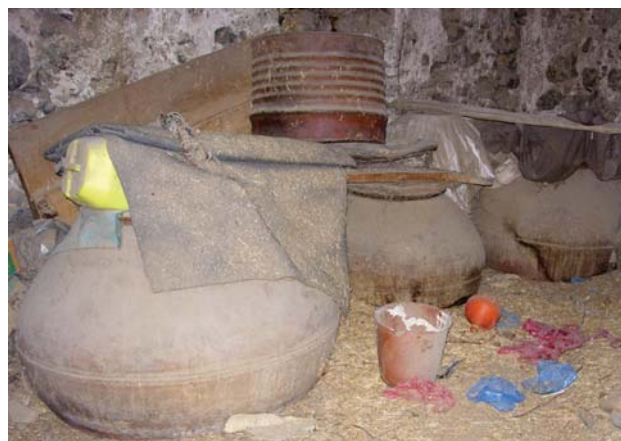
Fig. 7 : Pitharia à demi-enterrées, Chypre

way damage them » (Mariti 1984 : 54). L'ensevelissement total ou partiel dans une pièce de la maison ou dans une annexe s'est maintenu à l'époque moderne (fig. 7) (Ionas 2000 : 120).