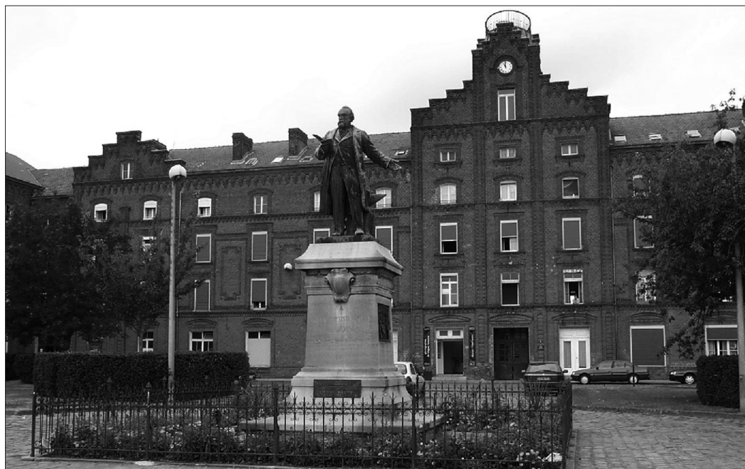
Photo 4 : Le pavillon central du Familistère Godin à Guise (cl. C. Hochedez, juillet 2003) Centerbuilding of the Godin Familistère in Guise

This cow, made out of old metal barrels will stay at the entrance of the village nine months after the "festivache" event is closed.