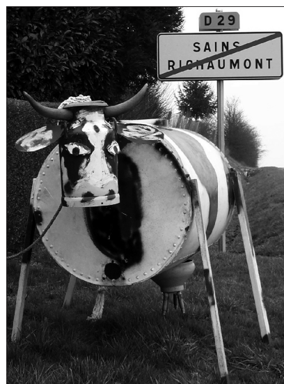
Photo 3 : Vache artistique en plein air

– Le projet Utopia entraîne l'opposition farouche de la population locale. Les raisons du blocage semblent assez évidentes. On pourrait arguer que l'opposition se porte sur le refus d'un projet imposé d'en haut, par le Conseil Général. La raison tient plus à l'enjeu social constitutif du projet. En effet, le projet de rendre à ce haut-lieu de l'utopie sociale sa dimension symbolique défend la patrimonialisation du site (photo. 4). Les habitants, retraités de l'usine Godin et veuves d'anciens ouvriers, souvent âgés et de condition modeste, refusent farouchement de quitter leurs logements. Pour eux, le Familistère est un patrimoine immobilier et affectif, alors que pour les concepteurs du projet il représente un patrimoine architectural et un témoin scientifique. Les deux approches s'opposent à tel point qu'on ne parle plus jamais du projet mais de la polémique qu'il suscite avec les habitants du familistère, constitués en association « Pour le droit de continuer à vivre au Palais social ».