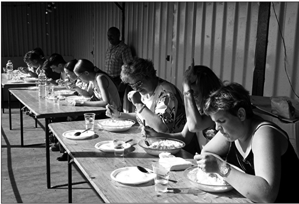
Photo 2 : Le concours du plus gros mangeur de fromage blanc

– Certains projets donnent à la population un rôle indispensable, tel le Festivache. Sans sa participation à la réalisation et à l'exposition des vaches en plein air, le projet n'existerait pas. La mise en place du concours de la plus belle vache constitue un facteur d'émulation. Le Festivache représente une réussite indéniable pour la participation de la population, au point que les organisateurs s'interrogent sur la conciliation entre participation de masse et production artistique. Le projet culturel oscille entre fête populaire (photo. 2) et manifestation artistique de plein air (photo. 3).