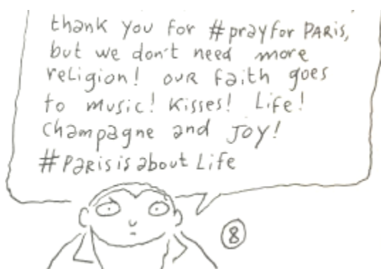
Figure 8 : Dessin de Joann Sfar concernant le hashtag #prayforparis

En outre, ce hashtag a été au centre de nombreuses polémiques sur Twitter concernant l'emploi du terme pray . Tout d'abord, notons que la suite #prayfor... fait partie de ces patrons dont un emplacement reste à remplir : Paris n'a donc été qu'un terme parmi mille autres à remplir cet espace libre. Toutefois, l'évocation de la prière semblait entrer en résonance assez négativement avec la teneur des événements parisiens. Face à l'immense succès du hashtag (Twitter a indiqué qu'en date du 14/11/2015 dans l'après-midi, 6,7 millions de mentions de ce hashtag avaient été faites, avec un pic à minuit atteignant 17 000 tweets par minute), on a observé une vague de voix contraires (LE VAILLANT & LIBÉRATION 2015) intimant à ceux qui signalaient ainsi leur empathie à choisir un autre terme, puisque c'est précisément au fanatisme religieux que l'on devait cette terreur. Le dessin de Joann Sfar, notamment, a été largement relayé sur les réseaux sociaux pour signaler ce désaccord sémantique – et proposer au passage un hashtag de remplacement :