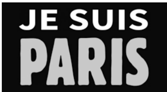
Figure 4: Logo sobre « Je suis Paris »

Parmi les quelques variations observables dans le sillage de cette nouvelle formule, on repère des procédés de modification similaires à ceux à l'œuvre pour « Je suis Charlie » :