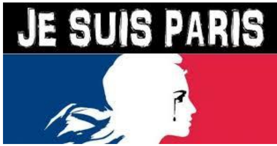
Figure 6 : Logo plus sophistiqué « Je suis Paris »