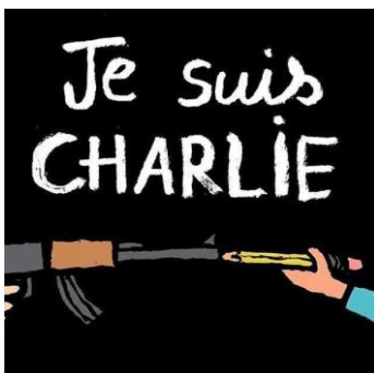
Figure 1 : Dessin de Jean Jullien, partagé sur la page de soutien à Charlie Hebdo sur Facebook