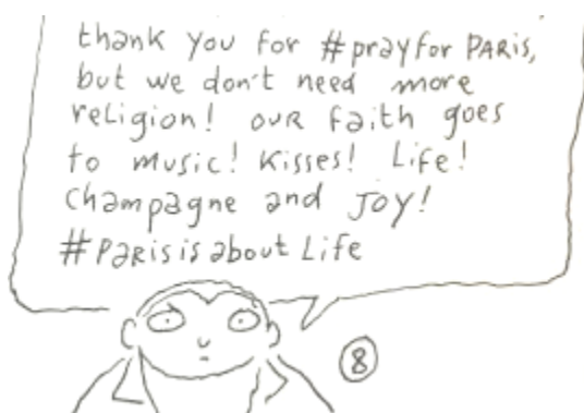
Figure 8 : Dessin de Joann Sfar concernant le hashtag #prayforparis

En outre, ce hashtag a été au centre de nombreuses polémiques sur Twitter concernant l'emploi du terme pray . Tout d'abord, notons que la suite #prayfor... fait partie de ces patrons dont un emplacement reste à remplir : Paris n'a donc été qu'un terme parmi mille autres à remplir cet espace libre. Toutefois, l'évocation de la prière semblait entrer en résonance assez négativement avec la teneur des événements parisiens. Face à l'immense succès du hashtag (Twitter a indiqué qu'en date du 14/11/2015 dans l'après-midi, 6,7 millions de mentions de ce hashtag avaient été faites, avec un pic à minuit atteignant 17 000 tweets par minute), on a observé une vague de voix contraires (LE VAILLANT & LIBÉRATION 2015) intimant à ceux qui signalaient ainsi leur empathie à choisir un autre terme, puisque c'est précisément au fanatisme religieux que l'on devait cette terreur. Le dessin de Joann Sfar, notamment, a été largement relayé sur les réseaux sociaux pour signaler ce désaccord sémantique – et proposer au passage un hashtag de remplacement :