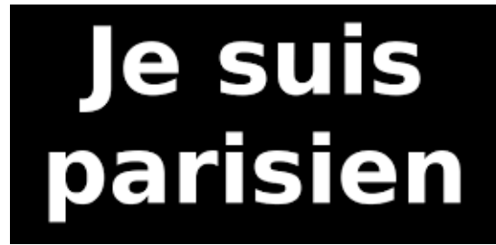
Figure 7 : Modification Paris => parisien

La figure 4 conserve les éléments, typographiques notamment, de la formule initiale « Je suis Charlie », ne modifiant que l'élément lexical 'Charlie' en 'Paris'. Quant à la figure 5, la typographie est quelque peu modifiée, tout en conservant les éléments principaux (lettres capitales, lettres blanches sur fond noir, disposition sur deux lignes), tandis qu'un élément symbolique, la Tour Eiffel, fait son apparition, tel le crayon ou le pinceau dans les représentations accompagnant la formule « Je suis Charlie ». La figure 6 est celle s'éloignant le plus de la configuration initiale, avec l'émergence de couleurs, de nouveaux éléments symboliques (Marianne en pleurs) et la modification de l'apparence du slogan, apparaissant désormais sur une ligne. Enfin, la figure 7 présente une variation où le nom propre Paris a été remplacé par l'adjectif correspondant parisien , variation proche de l'une de celles observées précédemment sur la formule « Je suis Charlie » (cf. Je suis policier/juif, etc. ).