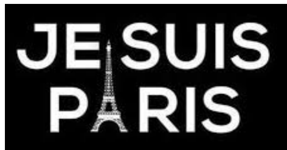
Figure 5: Logo « Je suis Paris » avec la Tour Eiffel