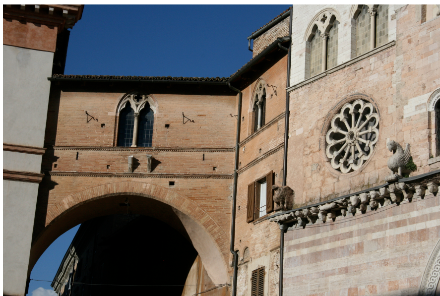
illustration 4 : Foligno, le pont reliant les demeures d'Ugolino III Trinci à la façade ouest du complexe cathédral (première décennie du XV e siècle) (novembre 2010)

À gauche du dessin, une partie des demeures des Trinci avant l'élévation de la façade néo-classique, puis le pont les reliant au complexe cathédral ; à droite, la façade occidentale de la cathédrale Saint-Félicien.