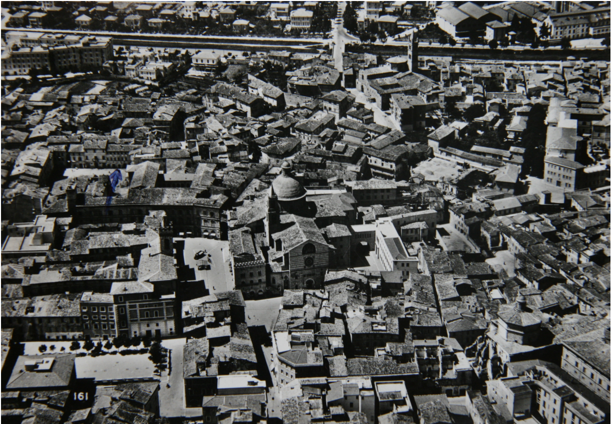
illustration 1 : Foligno, vue aérienne orientée vers le Nord, au début des années 1960 (d'après une carte postale ancienne, collection de l'auteur)

Au centre de l'image, le complexe cathédral avec, à sa gauche (à l'Ouest), la grande place de la commune (actuelle Piazza della Repubblica). Face au côté occidental de la cathédrale Saint-Félicien, séparé d'elle par la place, le complexe des palais communaux avec son campanile crénelé. Perpendiculairement aux deux édifices, au Nord, les résidences des Trinci (actuel Museo Trinci) dont trois des toitures, autour de la cour centrale, dessinent un U.