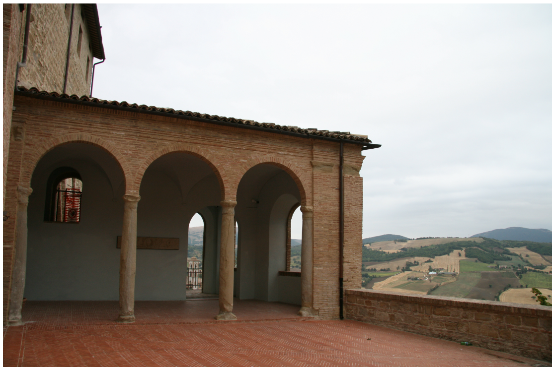
illustration 9 : Camerino, loggia des case vecchie dominant la vallée et les collines voisines (janvier 2009)

Au fond de l'image, on distingue les grandes ouvertures donnant sur la campagne vallonnée des environs.