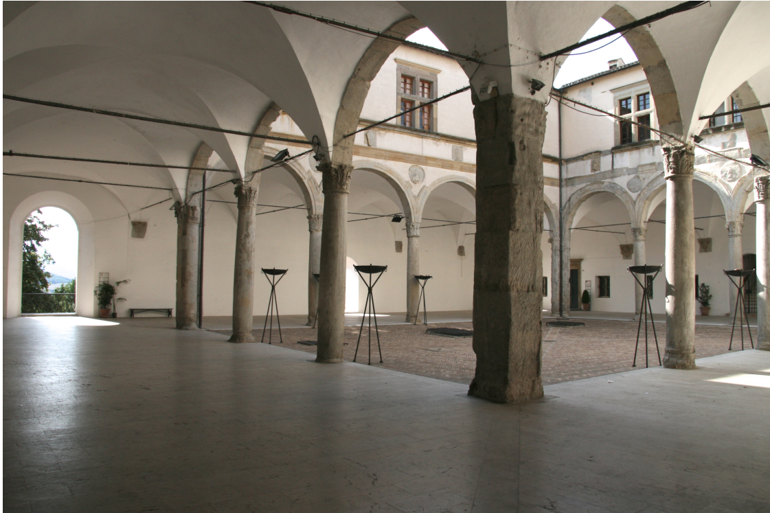
illustration 8 : Camerino, cour d'honneur des case nuove (vers 1490). Vue depuis le portail donnant sur la place (angle Nord-Est) (janvier 2009)

Au fond de l'image, on distingue les grandes ouvertures donnant sur la campagne vallonnée des environs.