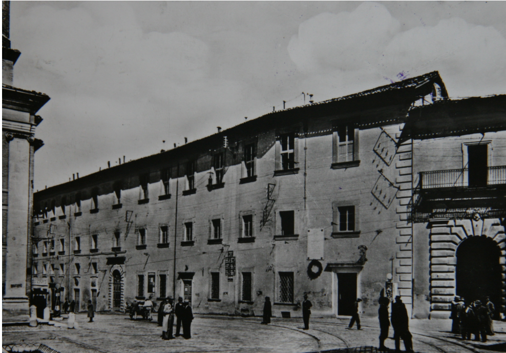
illustration 6 : Camerino, les demeures da Varano au début des années 1960 ; aujourd'hui siège de l'université

À gauche de l'image, on distingue la cathédrale Sainte-Marie-Majeure. Les case vecchie da Varano ont subi de grandes transformations depuis la fin du Moyen Âge. Les façades et leurs baies ont été modifiées. Le pont reliant le complexe cathédral (côté Sud) aux demeures des seigneurs a été détruit. À l'extrême droite de l'image, le portail monumental donnant sur la cour à portiques des case nuove de Giulio Cesare da Varano (vers 1490).