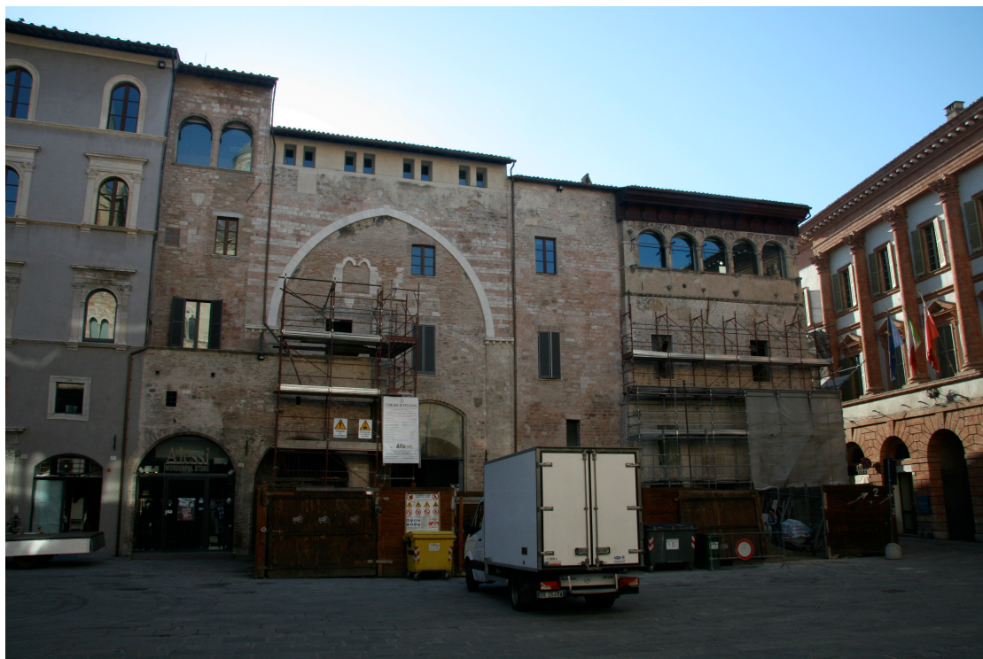
illustration 2 : Foligno, complexe des palais communaux médiévaux, côté Est (novembre 2010)

À gauche de l'image, le palazzetto de Pierorfino Orfini (1515). Dans la partie haute du dernier édifice de droite, les cinq arches de la loggia nuova des Trinci. À l'extrême droite de l'image, la façade néo-classique (1842-1847) plaquée sur les anciennes demeures seigneuriales. Le pont reliant le complexe de la commune et celui des seigneurs a été détruit.