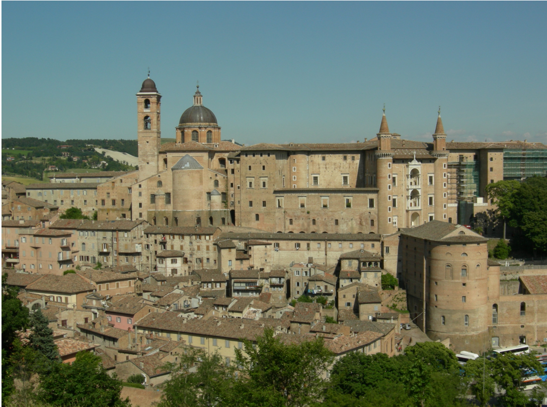
illustration 10 : Urbino, panorama de la ville vu depuis le Nord avec la cathédrale, le palais de Frédéric de Montefeltre et la tour de la Data 67

Au second plan à droite, la tour de la Data, à l'intérieur de laquelle se déploie la rampe hélicoïdale conçue par Francesco di Giorgio Martini (XV e siècle) pour relier le palais aux écuries, et que coiffe depuis le milieu du XIX e siècle le théâtre Sanzio ; au troisième plan, à gauche, la cathédrale avec le campanile et la coupole ; au centre, le palais ducal dont la façade Nord, avec ses loggias superposées et ses tourelles crénelées à clocheton, tranche sur les alentours par sa verticalité.