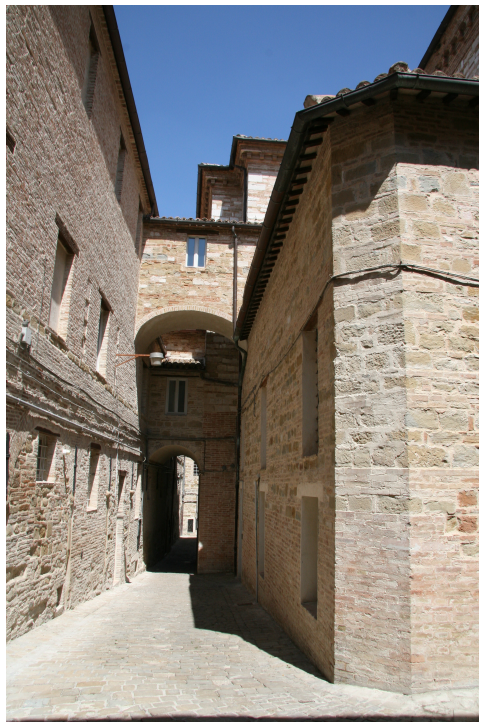
illustration 7 : Camerino, passages couverts reliant le complexe cathédral (côté Nord) à la maison des chanoines construite en partie au XIV e siècle (janvier 2009)

À gauche de l'image, on distingue la cathédrale Sainte-Marie-Majeure. Les case vecchie da Varano ont subi de grandes transformations depuis la fin du Moyen Âge. Les façades et leurs baies ont été modifiées. Le pont reliant le complexe cathédral (côté Sud) aux demeures des seigneurs a été détruit. À l'extrême droite de l'image, le portail monumental donnant sur la cour à portiques des case nuove de Giulio Cesare da Varano (vers 1490).