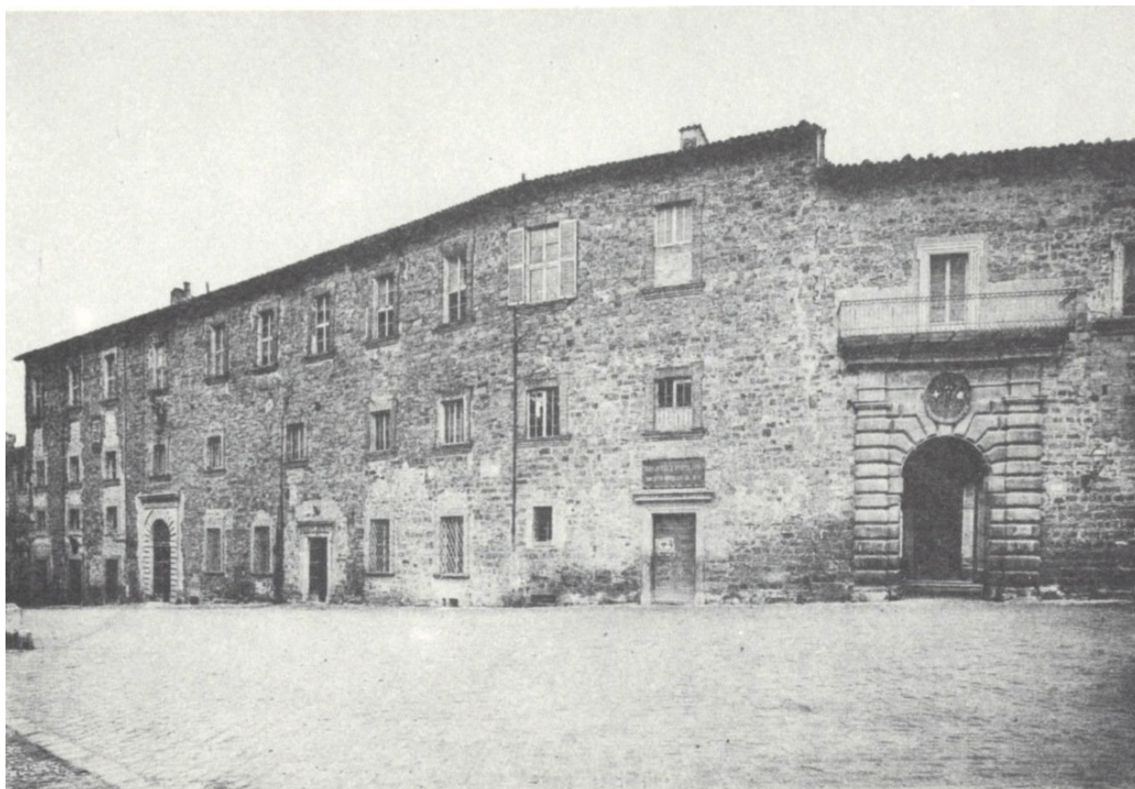
illustration 5 : Camerino, les demeures da Varano à la fin du XIX e siècle ; aujourd'hui siège de l'université (photo d'époque 66 )

L'image permet de distinguer les case vecchie, à gauche et au centre, des case nuove de Giulio Cesare, à droite, avec le décrochage de la toiture. Le portail monumental de cette dernière partie donne sur la cour à arcades, le cortile. Les fenêtres et la plupart des portes ont été modifiées à des dates postérieures à la seigneurie des da Varano.