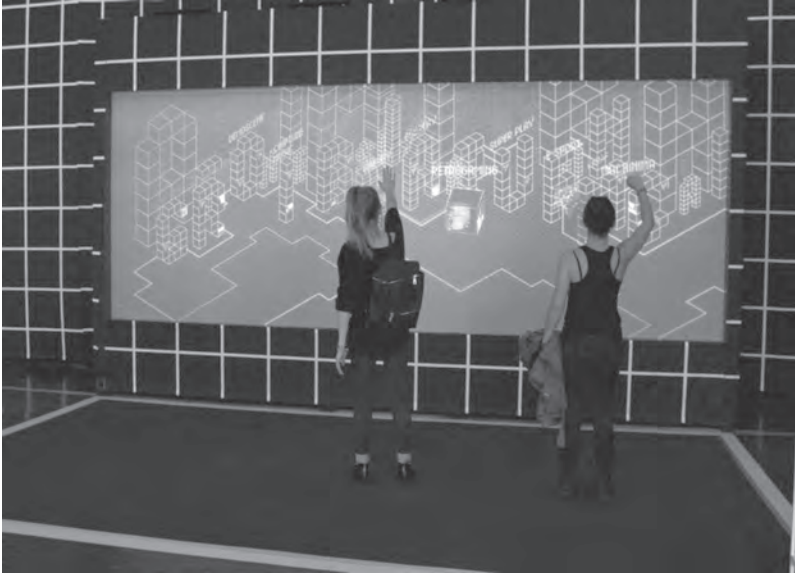
Fig. 1 : Vue de l'installation.

que montre Simon (2009) à propos de la console Wii 6 en tant que moyen de réunir la famille dans une expérience partagée, autour d'un même écran, dans l'exposition étudiée, l'objectif semble également résider dans la transformation d'une fonction individuelle (la sélection de contenus) en une activité collective.