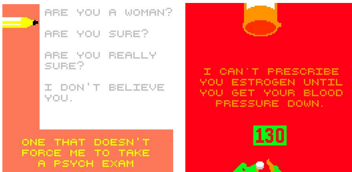
Figure 1 et 2 : captures d'écran du jeu Dys4ia

Depuis leur création, les jeux vidéo font l'objet d'appropriations diverses. Nous interrogerons ici le travail de créatrices se définissant comme queers et trans , dont les productions permettent d'interroger de nombreuses représentations considérées comme standards. Regroupé.e.s sous l'appellation « Zinesters » en référence à la création de fanzines, ces amateurs et amatrices, créent sur leur temps libre sans but commercial, mais avec l'envie de partager un message ou une expérience. Pour explorer cette création à la marge, nous avons choisi trois jeux récents, bien souvent autobiographiques, qui permettent d'interroger les politiques de représentation courantes dans les jeux vidéo, qu'il s'agisse des personnages, des thèmes abordés, de la production ou des publics.