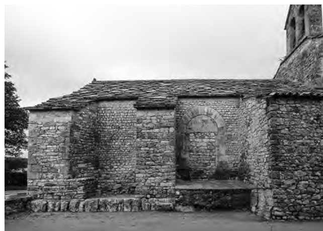
Fig. 10 – SAINT-MICHEL-L'OBSERVATOIRE, église Sainte-Madeleine de Lincel. Vue du gouttereau sud depuis l'extérieur.

tradition architecturale romane, quoique plus tardive (XIII e -XIV e s. ?). On notera ainsi le soin apporté à la mise en œuvre de la voûte à lunette du transept et du berceau du chœur, appareillés à l'aide d'un moyen appareil de tuf parfaitement ajusté, la forme rectangulaire de la baie axiale du chœur, ou encore la présence d'un enfeu au revers du bras sud du transept.