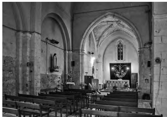
Fig. 8 – SAINT-MICHEL-L'OBSERVATOIRE, église Saint-Pierre. Vue de la nef et du chœur depuis le sud-ouest (cliché SDA04).

De ce premier édifice qui devait être à nef unique et voûté en berceau, subsiste également la partie haute du parement du gouttereau sud, observable depuis l'extérieur de l'église actuelle, ainsi qu'une partie des piles cruciformes du même mur, tardivement percé par une série de chapelles latérales. Un dallage de calcaire, mis au jour à l'angle nord-est entre la nef et le chœur, pourrait aussi appartenir à ce premier état.