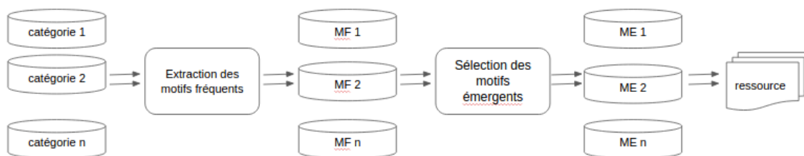
FIGURE 1 – Vue générale du processus de création de ressource

quelles l'ordre temporel caractérise les données (Agrawal et Srikant, 1995).