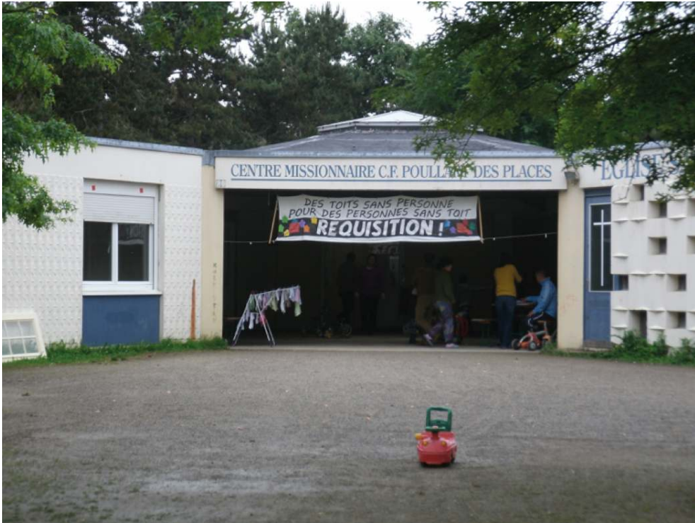
© Céline Bergeon, Anne-Cécile Hoyez. Juin 2013