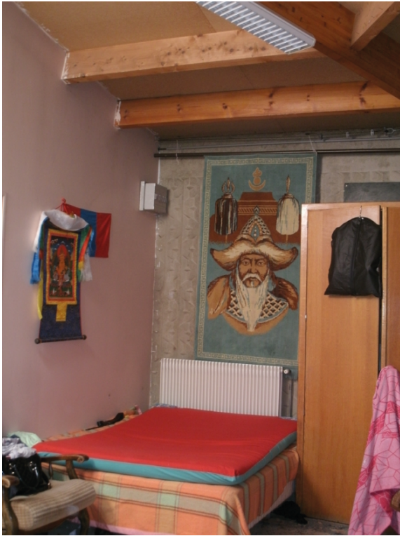
© Céline Bergeon, Anne-Cécile Hoyez. Juin 2013