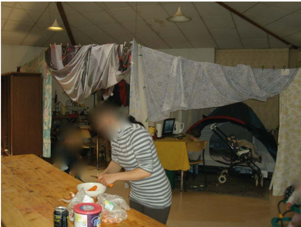
© Céline Bergeon, Anne-Cécile Hoyez. Juin 2013