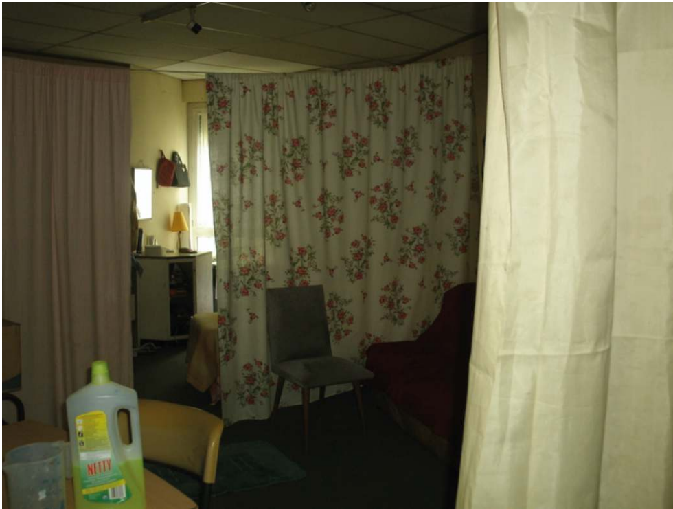
© Céline Bergeon, Anne-Cécile Hoyez. Juin 2013