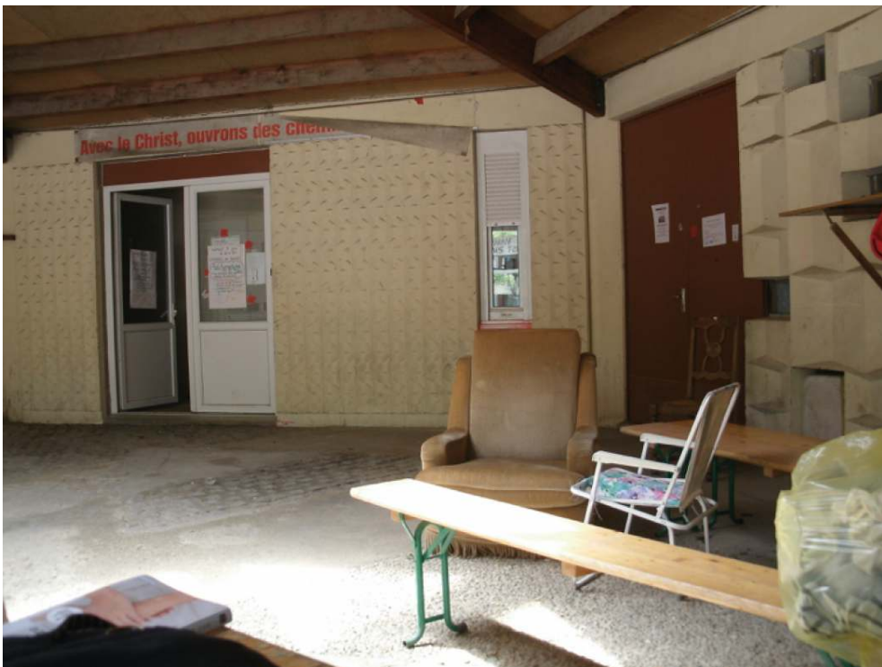
© Céline Bergeon, Anne-Cécile Hoyez. Juin 2013