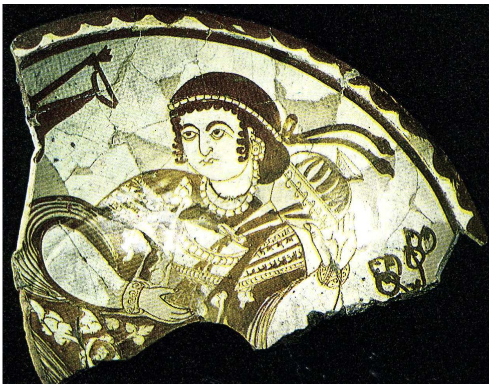
Figure 3 : Tesson de coupe en céramique, Égypte, époque fatimide (XI e siècle ?), Le Caire, Musée d'art islamique