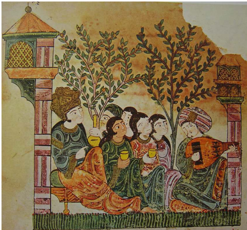
Figure 4 : Qiṣṣat Bayāḍ wa-Riyāḍ ( Histoire de Bayād et de Riyād ), Vatican, Bibliothèque apostolique, ms. Arabe 368, fol. 10 (copie réalisée en Andalus ou au Maroc)