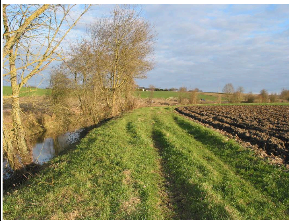
Figura 2 – Faixa de vegetação herbácea na bacia hidrográfica do Layon