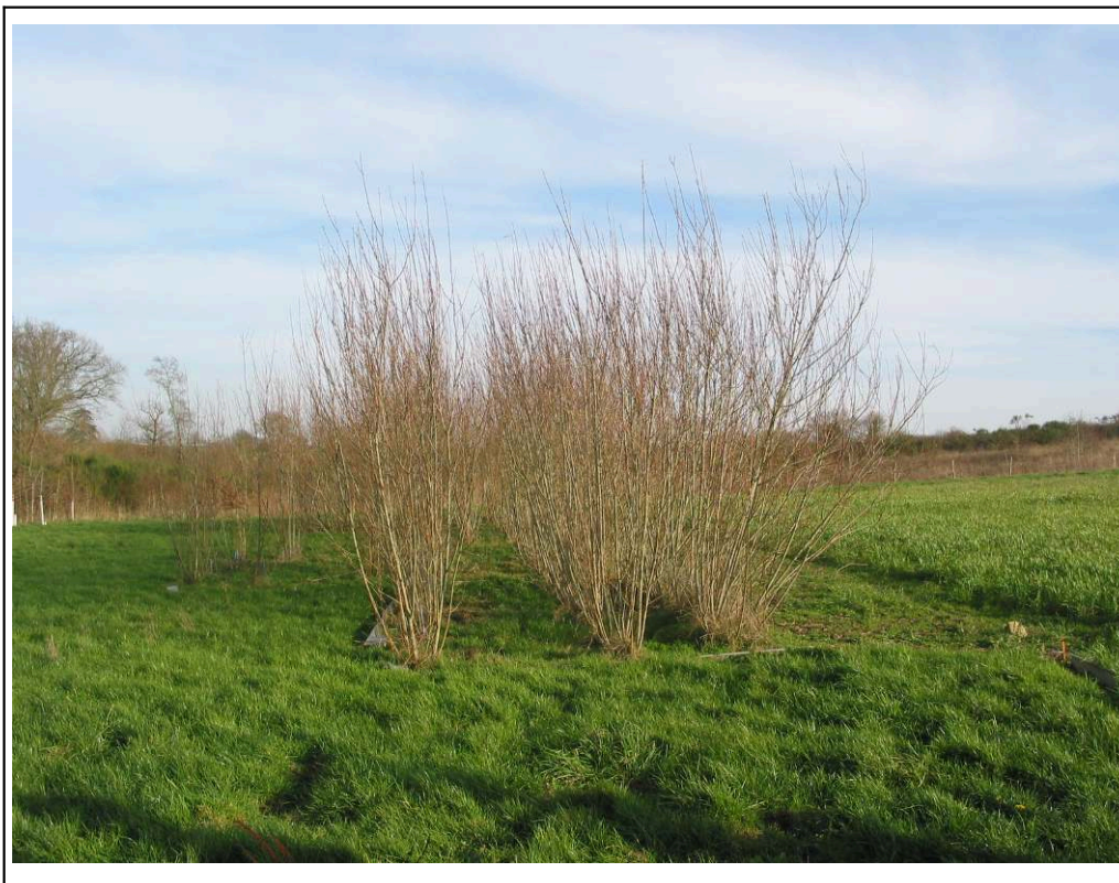
Figura 3 – Faixa de vegetação herbácea com vegetação arbórea de Salseiros, na localidade de la Jaillère (área experimental de Arvalis – instituto do vegetal)