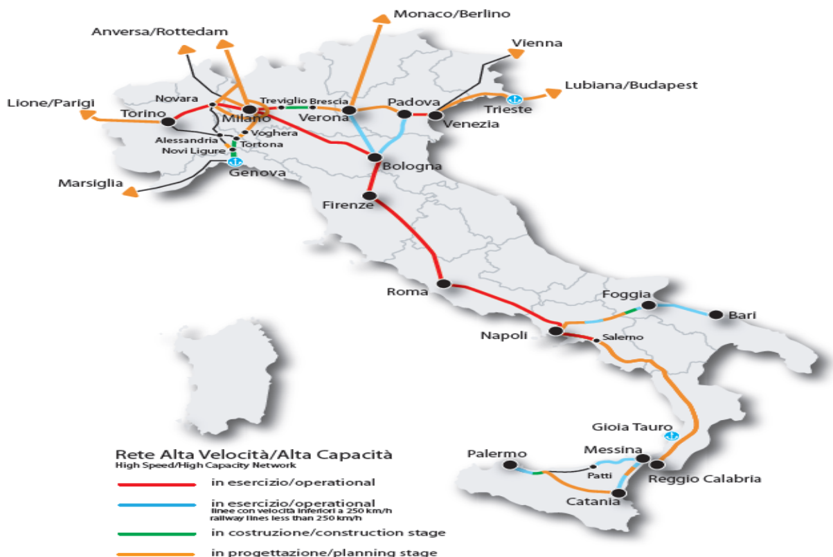
Figure 2. Le réseau ferroviaire italien à grande vitesse

NTV aura ainsi pu bénéficier d'entrée d'un réseau à grande vitesse quasi-complet, de 923 kilomètres. Sachant que le réseau ferroviaire desservi par les trains à grande vitesse est encore plus étendu, du fait que les trains à grande vitesse circulent également sur le réseau ferroviaire conventionnel, à des vitesses plus faibles, afin de maximiser l'effet de réseau.