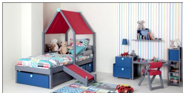
5. Vibel "Classic". Site Internet Vibel 2013

Enfin, des thèmes comme l'enfantin et le ludique s'exprimeront au travers d'une mise en scène de couleurs primaires et du caractère évolutif du mobilier qui peut être recomposé ou déplacé en fonction des envies de jeu et d'activités développées par l'enfant. Certains accessoires permettent de transformer les lits et autres éléments mobiliers en cabanes, puis en bureaux au fur et à mesure que l'enfant grandit et diversifie ses centres d'intérêt ou ses activités (ill.5).