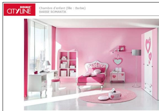
2. Catalogue Doimo Concept 2010.

Encore aujourd'hui, une chambre d'enfant est reconstituée en fonction d'une grande partie de ces codes normatifs. Par exemple, la chambre de petite fille est présentée de façon très structurée avec des espaces précis (bureau, armoire, lit, etc.) : tout y est net et ordonné (ill. 2). Ce type de représentation peut être interprété comme une actualisation des rhétoriques présentes dès le XIX e siècle, relatives à l'éducation ménagère des petites filles destinées à être les garantes de l'hygiène domestique et de l'intimité familiale.