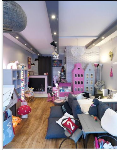
1. Boutique Les enfants terribles, Neuilly-sur-Seine.

Les objets sont présentés en un désordre savamment organisé (O. Badot et G. Paché, 2007), dans une continuité ininterrompue visant à connoter l'abondance. L'objet peut y donner lieu à une mise en scène singularisante, c'est-à-dire, en lien avec d'autres objets qui ne sont pas à vendre et qui, de ce fait, font référence à l'intime, à la sphère privée liée aux goûts personnels de l'enfant qui y vit et de ses parents. On pourrait se poser la question du choix : du dispositif lui-même et de la mise en scène du choix. En effet, l'offre présente ici une grande variété d'objets, dont le désordre apparent ouvre tout un champ de possibilités au consommateur qui peut ainsi laisser libre cours à sa créativité. Cet espace de créativité est donc laissé au consommateur pour créer sa propre ambiance.