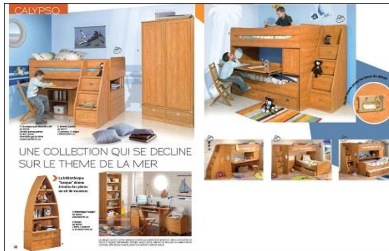
14. Collection « Calypso ». Catalogue Gautier 2012-2013.

La première image « genre » l'offre, alors que les deux suivantes permettent de dérouler l'ensemble de la collection. La chambre qui est donnée à voir ici est celle d'un petit garçon représenté comme sage, en cohérence avec la cible parentale visée. La sérialisation permet de révéler différentes dimensions, ou alternatives, d'un même produit... Ainsi la chambre va être détaillée afin de permettre au consommateur de s'imaginer le produit qui s'adapterait le mieux à son intérieur... et ainsi commencer à se l'approprier. L'histoire racontée est celle d'un enfant qui grandit et s'épanouit dans une chambre qui favorise tout à la fois le développement de ses talents et ses amusements. Examinons la série consacrée à une collection pour petites filles de 6-9 ans (ill. 15)