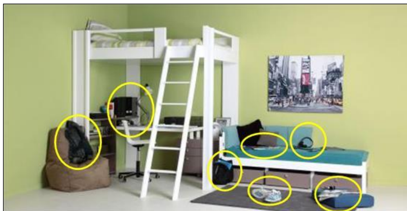
8. Des traces de mouvements adolescents

Cependant, dans ces images nettes, qui semblent à la limite du stéréotype, l'enfant est absent, ne restent que les traces de son passage. En effet, la photographie, à travers ce qu'elle montre, révèle ce qui a été. Ainsi, une annonce employant ce format, montre qu'un enfant a été dans cette chambre, y a séjourné, y a dormi, y a travaillé, et surtout y a joué – que l'enfant soit présent sur la photo ou non. Contrairement à la peinture ou au dessin, la photographie, du fait qu'elle donne à voir une pseudo-réalité, n'a pas un pouvoir de projection ou d'identification très grand : même si certaines d'entre elles génèrent un grand nombre d'imageries mentales, leur pouvoir d'appropriation demeure limité ; c'est sans doute pour cette raison qu'un texte en renfort permet d'opérer ce genre de « transfert » identitaire et affectif.