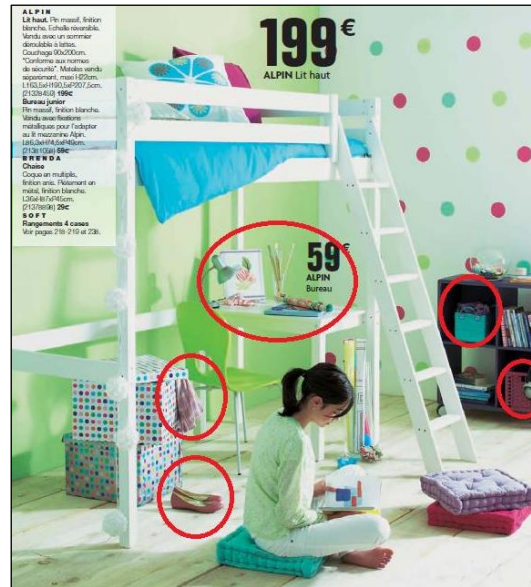
9. Ce que les annonces donnent à voir. Lit Alpin, catalogue Alinéa, 2011.

L'illustration numéro 8 nous donne à voir les traces du passage d'un adolescent, qui a jeté son blouson sur le pouf, qui aime écouter de la musique (une chaine hi-fi sur le bureau, un casque sur la banquette). Ce qui nous permet de qualifier l'âge de la cible est un relatif désordre ambiant et volontairement mis en scène (le blouson jeté sur le pouf, le sac ouvert, les baskets négligemment posées au sol et des papiers par terre). Cette mise en scène de la figure du désordre est caractéristique d'une offre dont le genre du cœur de cible serait plutôt masculin.