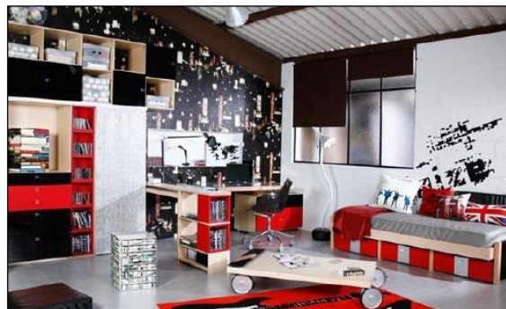
3. Ambiance « Punk Rock ». Site Internet Vibel 2011.

En revanche, en ce qui concerne les garçons, les chambres mises en scène se réfèrent davantage à une culture de l'extérieur, à l'aventure... L'espace clos de la chambre fait référence à ce qui se passe en-dehors de la maison, dans la rue, dans des espaces à découvrir et à conquérir (ill. 3 et 4).