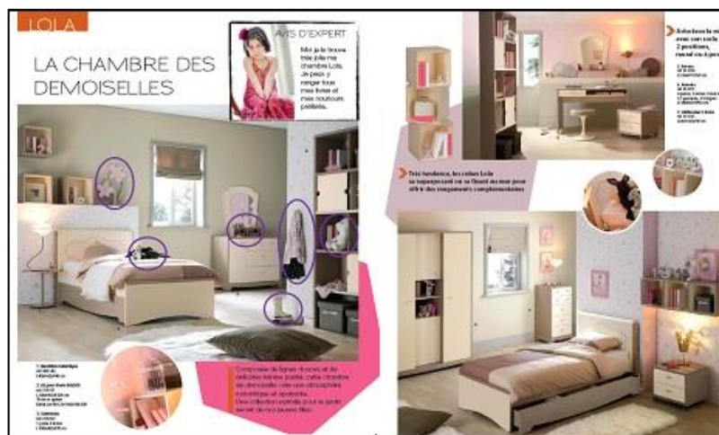
15. Collection « Lola ». Catalogue Gautier 2012-2013

La première image « genre » l'offre, alors que les deux suivantes permettent de dérouler l'ensemble de la collection. La chambre qui est donnée à voir ici est celle d'un petit garçon représenté comme sage, en cohérence avec la cible parentale visée. La sérialisation permet de révéler différentes dimensions, ou alternatives, d'un même produit... Ainsi la chambre va être détaillée afin de permettre au consommateur de s'imaginer le produit qui s'adapterait le mieux à son intérieur... et ainsi commencer à se l'approprier. L'histoire racontée est celle d'un enfant qui grandit et s'épanouit dans une chambre qui favorise tout à la fois le développement de ses talents et ses amusements. Examinons la série consacrée à une collection pour petites filles de 6-9 ans (ill. 15)