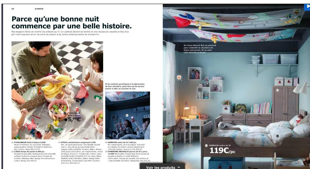
11. Chambre d'enfant, catalogue Ikéa 2012-2013.

C'est ainsi que la première chambre d'enfant, présentée ci-dessous, se retrouve placée entre une chambre d'adultes et une chambre d'adolescent (ill. 11). La façon dont cette série est organisée laisse donc penser qu'elle vise plutôt à mettre en scène des activités conjointes, créatives, avec l'adulte et des activités conjointes, ludiques, avec des pairs, comme vecteur de compréhension de la collection, avant même de présenter l'ensemble de la collection des chambres d'enfant qui constituent le territoire que la marque a investi. Nous pouvons en déduire que ce qui est donné à voir au travers de cette série est un espace d'échanges, de créativité et de jeux servant aussi accessoirement à l'enfant à dormir. Ainsi, la chambre n'est plus seulement un lieu de sommeil mais bien un lieu à vivre et dans lequel on va prendre du plaisir au cours d'activités partagées avec la famille ou les amis : c'est un lieu où l'enfant découvre ses talents et épanouit sa personnalité.