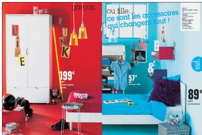
6. Les couleurs et le système d'objets qualifient la cible de la chambre.

Les couleurs et systèmes d'objets peuvent suffire à différencier une offre pourtant neutre et identique au départ. La neutralisation du genre dans le produit lui-même semble répondre à une logique économique et financière de rationalisation des coûts de production. Il n'y a aucune « fermeture » symbolique du produit (aucune « Plus Petite Différence Commune » au sens de Baudrillard 1973), son assignation à chaque sexe au travers du système des objets et des couleurs de chacune des annonces ciblée devenant le plus sûr moyen de garantir son « ouverture » commerciale. Le slogan, qui mobilise la notion d' « accessoires », exprime alors parfaitement l'empilement des supercheries symboliques sur lesquelles repose ici le procédé de captation : tout en tirant parti du terme abstrait « accessoires », la mise en scène fait passer pour louable, voire progressiste, la définition inégalitaire de l'égalité au travers d'un système d'objets stéréotypés dont l'objectif demeure ancré dans un système de valeurs strictement marchand (ill. 6).