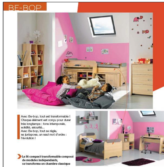
13. Chambre « Be-Bop ». Catalogue Gautier 2012-2013.

Ainsi, le « consommateur hybride enfant-parents », lecteur du catalogue, est, d'une part amené à décrypter une forme d'écriture au travers de la lecture de chaque photographie, tandis que d'autre part la série le conduit à rechercher le sens véhiculé par l'ensemble des clichés présentés. Pour quelle fasse sens, chaque image a été déterminée en fonction de l'espace et du temps, de manière à donner une illusion de continuité nécessaire à la compréhension de la signification que la collection ainsi mise en scène contribue à construire. Car ce travail nécessite une réflexion en amont de la part du photographe et de l'équipe éditoriale, dans la mesure où la séquence photographique est étroitement associée à la mise en scène. En ce sens, il s'agit ici d'une photographie « construite ». À titre d'exemple, la série suivante montre comment la séquence photographique replace l'action au cœur de la collection et permet de démontrer le caractère évolutif du lit notamment (ill. 13).