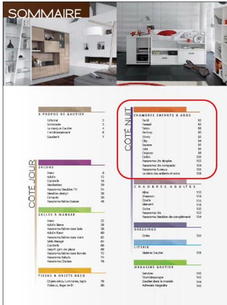
12. Sommaire du catalogue Gautier 2012-2013.