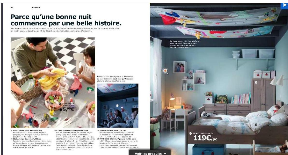
11. Chambre d'enfant, catalogue Ikéa 2012-2013.

C'est ainsi que la première chambre d'enfant, présentée ci-dessous, se retrouve placée entre une chambre d'adultes et une chambre d'adolescent (ill. 11). La façon dont cette série est organisée laisse donc penser qu'elle vise plutôt à mettre en scène des activités conjointes, créatives, avec l'adulte et des activités conjointes, ludiques, avec des pairs, comme vecteur de compréhension de la collection, avant même de présenter l'ensemble de la collection des chambres d'enfant qui constituent le territoire que la marque a investi. Nous pouvons en déduire que ce qui est donné à voir au travers de cette série est un espace d'échanges, de créativité et de jeux servant aussi accessoirement à l'enfant à dormir. Ainsi, la chambre n'est plus seulement un lieu de sommeil mais bien un lieu à vivre et dans lequel on va prendre du plaisir au cours d'activités partagées avec la famille ou les amis : c'est un lieu où l'enfant découvre ses talents et épanouit sa personnalité.