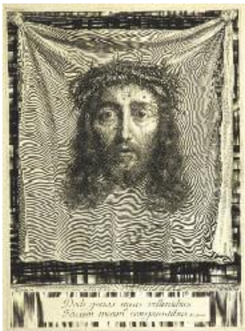
Ill. 4. Jean Alix, La Sainte Face .