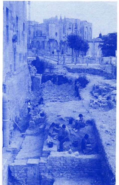
En fouille en 1978...