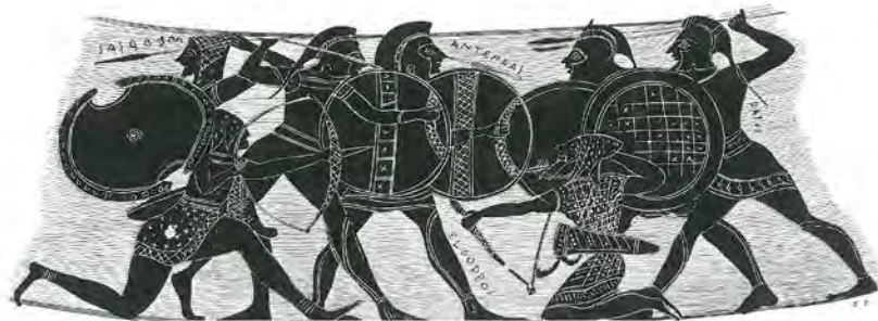
Archives 057, 06, 02, 01. Vases à figures noires : reproductions de diverses figures