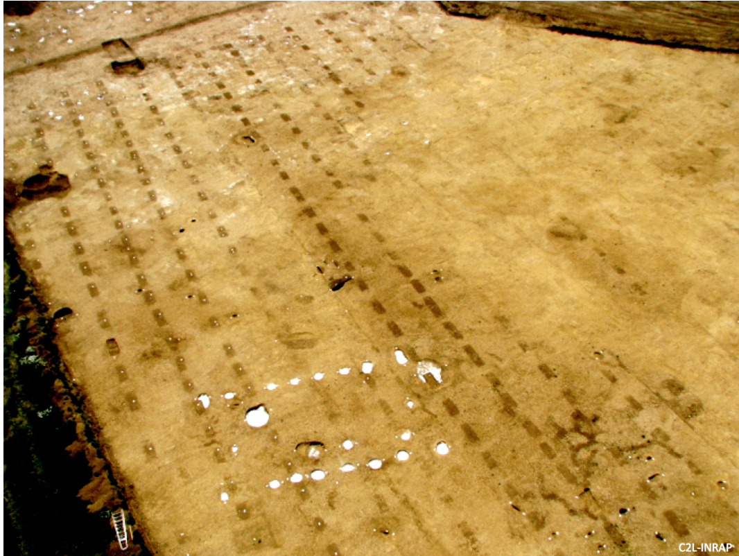
Illustration 2 – Vue aérienne des rangs de fosses de plantations de la vigne gallo-romaine de Gevrey-Chambertin

Cette métrique rigoureuse est peu parlante dans nos unités de mesures, mais quand on l'exprime en pieds romains (1 pied = 29,7 cm), les fosses étudiées ont des dimensions en chiffres ronds: longueur \approx 3 à 4 pieds ; largeur \approx 2 pieds ; espacement \approx 3-4 pieds ; distance entre les rangs \approx 10 pieds. C'est un indice pour interpréter cette plantation comme un vignoble d'époque romaine car on retrouve ces dimensions dans les recommandations de Columelle au 1 er s. ap. J.-C.. La présence de deux creusements par fosse, séparées par un « bourrelet médian » est une modalité inédite dans les pratiques agricoles modernes et n'est pas connue à l'époque médiévale. C'est par contre un mode antique de plantation de la vigne à plusieurs plants par fosse, préconisé par Pline l'Ancien (type alveus , Histoire Naturelle , XVII) et Columelle ( De l'Agriculture , liv. 3 ème , XV). Ce dernier recommande pour les jeunes plants de « les arranger en les courbant de façon que les racines des deux marcottes qui sont dans la même fosse ne s'entrelacent pas mutuellement, ce qui sera facile d'empêcher en disposant au fond des fosses, transversalement et par le milieu, quelques pierres, dont chacune n'excède pas le poids de cinq livres », un dispositif qui peut correspondre aux bourrelets médians observés au fond des fosses.