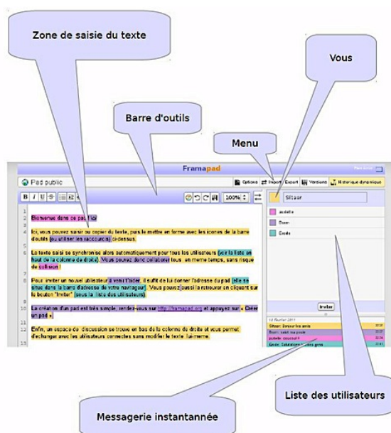
Fig 1 : Interface Framapad 2

L'interface de Framapad inclut des outils élémentaires de traitement de texte, et permet aux participants d'exporter leur texte, une fois créé, vers divers formats (word, pdf entre autres), ou simplement le laisser en ligne pour le partager à l'aide du lien d'accès. Outre l'édition de texte, Framapad offre une fenêtre de tchat , dans laquelle les participants peuvent interagir durant la rédaction du texte.