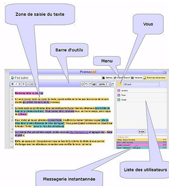
Fig 1 : Interface Framapad 2

L'interface de Framapad inclut des outils élémentaires de traitement de texte, et permet aux participants d'exporter leur texte, une fois créé, vers divers formats (word, pdf entre autres), ou simplement le laisser en ligne pour le partager à l'aide du lien d'accès. Outre l'édition de texte, Framapad offre une fenêtre de tchat , dans laquelle les participants peuvent interagir durant la rédaction du texte.