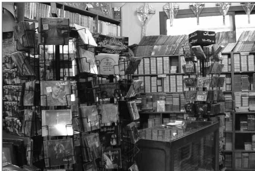
3. Étalage de disques, cassettes audio, vidéos et DVD dans la boutique du Moqatam (lieu de pèlerinage, Le Caire, février 2007, Severine Gabry).

Il est ainsi possible de trouver, dans l'enceinte de chaque église, des points de vente d'objets en tous genres, relatifs à la religion. Parmi eux, on trouve des compact-discs, des cassettes, des DVD, des cassettes VHS et des cédéroms. Leur contenu concerne la musique liturgique, mais pas seulement. On peut, en effet, constater la présence d'enregistrements de compositions modernes de musique, de cours donnés par des chantres, de concerts organisés lors de manifestations religieuses, de films, etc. Un aspect ludique existe aussi pour les enfants, avec un développement de disques, de films et de dessins animés liés au catéchuménat. La vente d'objets multimédias trouve ainsi son essor dans la diffusion auprès des fidèles, particulièrement friands de ces nouveaux supports.