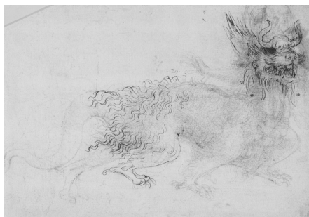
Fig. 5. Leonardo, Studio per un dragone , ca. 1517-8, Windsor, RL 12369.

Inoltre è il modo di generare la figura attraverso le linee flessuose e ondulate del manto, delle zampe artigliate e delle corna che ben rendono l'idea del moto. Un'eccezione in chiave ludica è il delizioso disegno dell' Unicorno dell'Ashmolean Museum di Oxford (fig. 6), che illustra la credenza per cui con l'immersione del suo corno poteva purificare l'acqua avvelenata dai serpenti. Anziché come un fiero animale mitico, Leonardo lo raffigura come un cavallino indifeso caratterizzato da una straordinaria flessibilità della posa, simile per certi versi agli studi sul gatto di cui abbiamo parlato. La sua definizione elementare lo accomuna con il tenero elefantino raffigurato sullo sfondo dell' Adorazione dei Magi (fig. 7), con cui condivide una certa vena infantile nell'intenzione grafica, sintetica ma incredibilmente gioiosa. Il fantastico sfocia qui in gioco ludico ma non si svincola dal metodo scientifico-catalogatorio del reale di Leonardo che, pur funzionando per 'difetto' e non per 'electio', seleziona, studia e cataloga il mondo in continuo movimento.