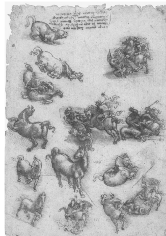
Fig. 2. Leonardo, Studi di cavalli, un San Giorgio, draghi e un leone , ca. 1517-18, Windsor, RL 12331.