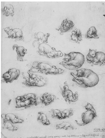
Fig. 1. Leonardo, Studi di gatti, leoni e un drago , ca. 1513-16, Windsor, RL 12363.