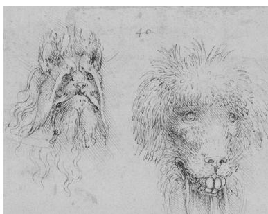
Fig. 3. Leonardo, Due teste di animali grotteschi , ca. 1490-95, Windsor, RL 12367.