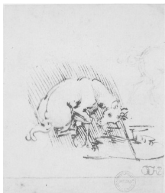
Fig. 6. Leonardo, Unicorno , Oxford, The Ashmolean Museum, inv. WA1855.83.2.

Inoltre è il modo di generare la figura attraverso le linee flessuose e ondulate del manto, delle zampe artigliate e delle corna che ben rendono l'idea del moto. Un'eccezione in chiave ludica è il delizioso disegno dell' Unicorno dell'Ashmolean Museum di Oxford (fig. 6), che illustra la credenza per cui con l'immersione del suo corno poteva purificare l'acqua avvelenata dai serpenti. Anziché come un fiero animale mitico, Leonardo lo raffigura come un cavallino indifeso caratterizzato da una straordinaria flessibilità della posa, simile per certi versi agli studi sul gatto di cui abbiamo parlato. La sua definizione elementare lo accomuna con il tenero elefantino raffigurato sullo sfondo dell' Adorazione dei Magi (fig. 7), con cui condivide una certa vena infantile nell'intenzione grafica, sintetica ma incredibilmente gioiosa. Il fantastico sfocia qui in gioco ludico ma non si svincola dal metodo scientifico-catalogatorio del reale di Leonardo che, pur funzionando per 'difetto' e non per 'electio', seleziona, studia e cataloga il mondo in continuo movimento.