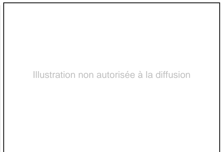
Fig. 13. Détail de la façade Ouest du bâtiment transversal, avec les trois états de construction.