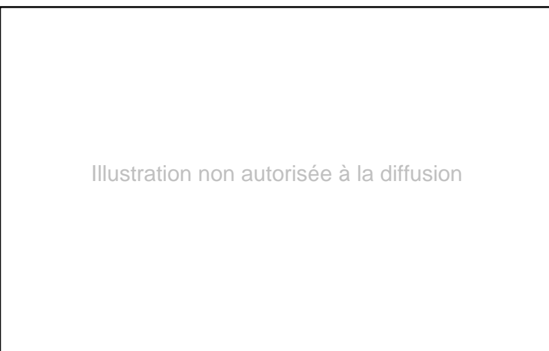
Fig. 12. La façade Nord du bâtiment bordant la cour orientale au Sud, avec l'appareil caractéristique du premier état.