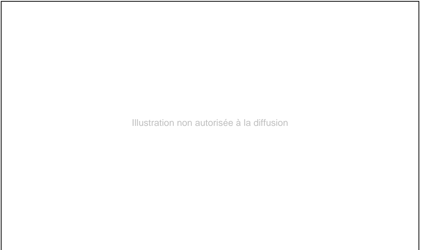
Fig. 11. Plan schématique du manoir de Potamia (R. Thernot).