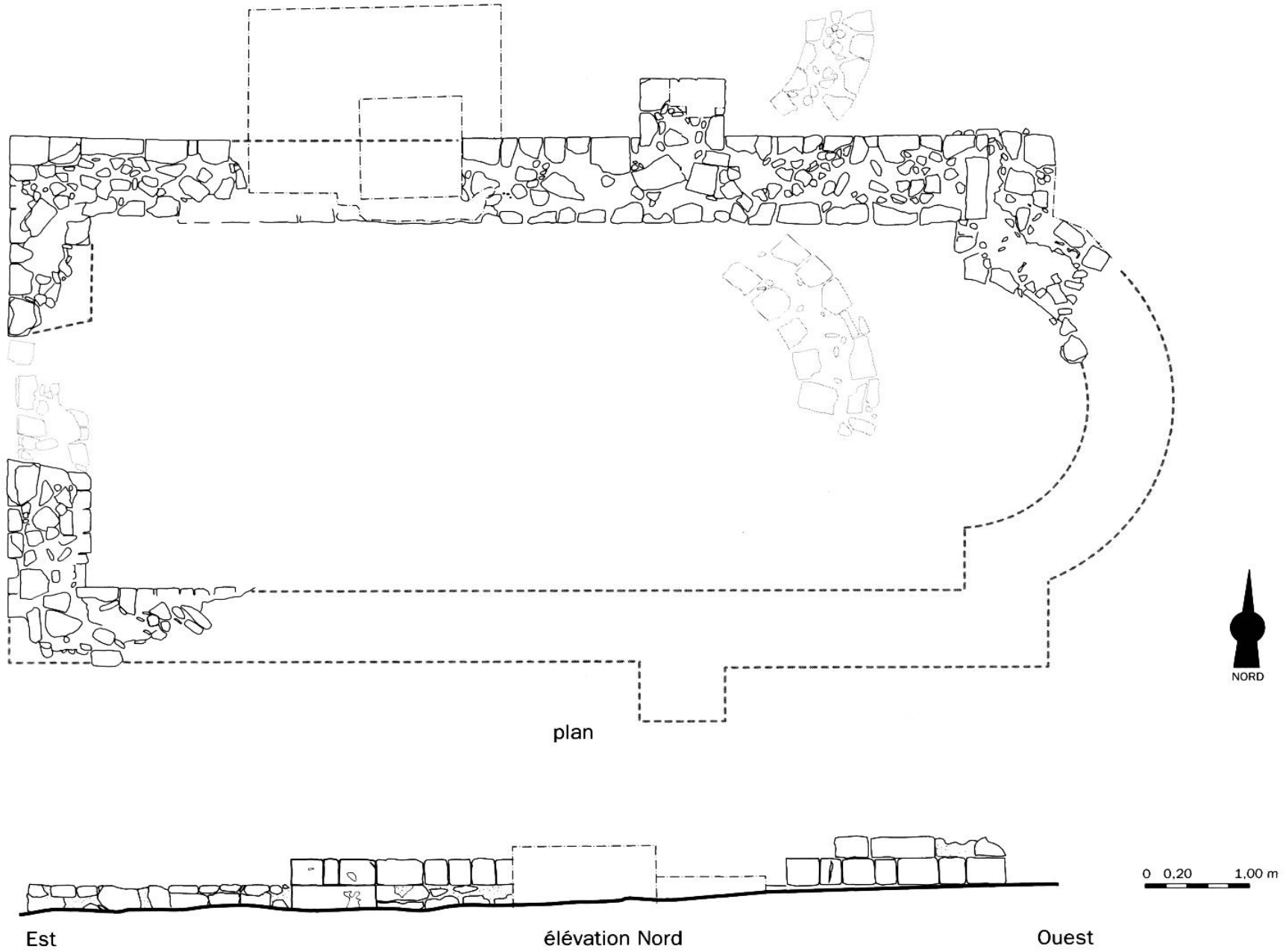
Fig. 9. Chapelle Sainte-Catherine : relevé et élévation Nord (R. Thernot).