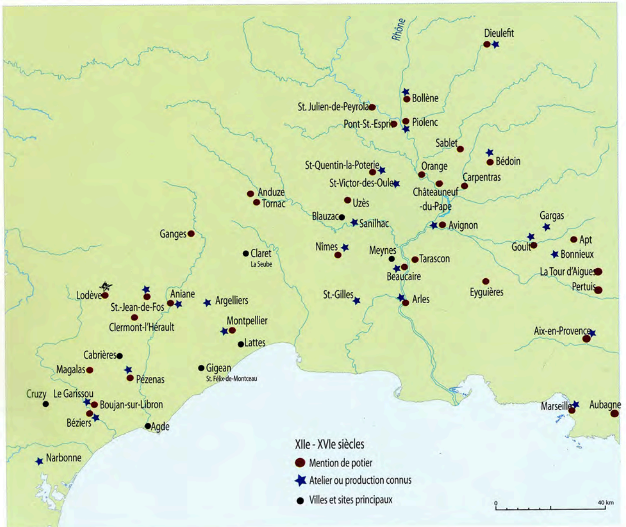
Carte des ateliers de poterie en Languedoc Localisation des ateliers de potiers mentionnés par les textes et l'archéologie, XII e -XVI e siècles

La collecte effectuée lors de travaux urbains dans le cœur de la vieille ville au moment du creusement du parking de la place de la Comédie avait cependant révélé, au niveau du fond des fossés de la ville et des pieux en chêne enfoncés dans le sol naturel, quelques centaines de tessons de céramique. Ces derniers, attribuables à la première moitié du XIV e siècle, regroupaient diverses