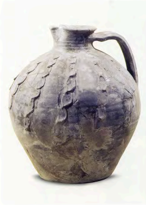
Fig. 22 Coupe en émail peint. H. conservée 4,8 cm, L. 16,5 cm. Montpellier, rue de la Fontaine-du-Pila. Lattes, Musée Henri Prades. Inv. 25814