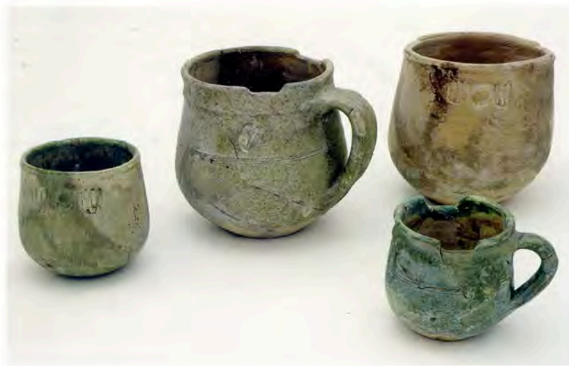
Fig. 7 Mesures en émail monochrome. H. 7,8 cm, 9 cm, 12,6 cm, 13 cm. Montpellier, puits de la Barralerie.