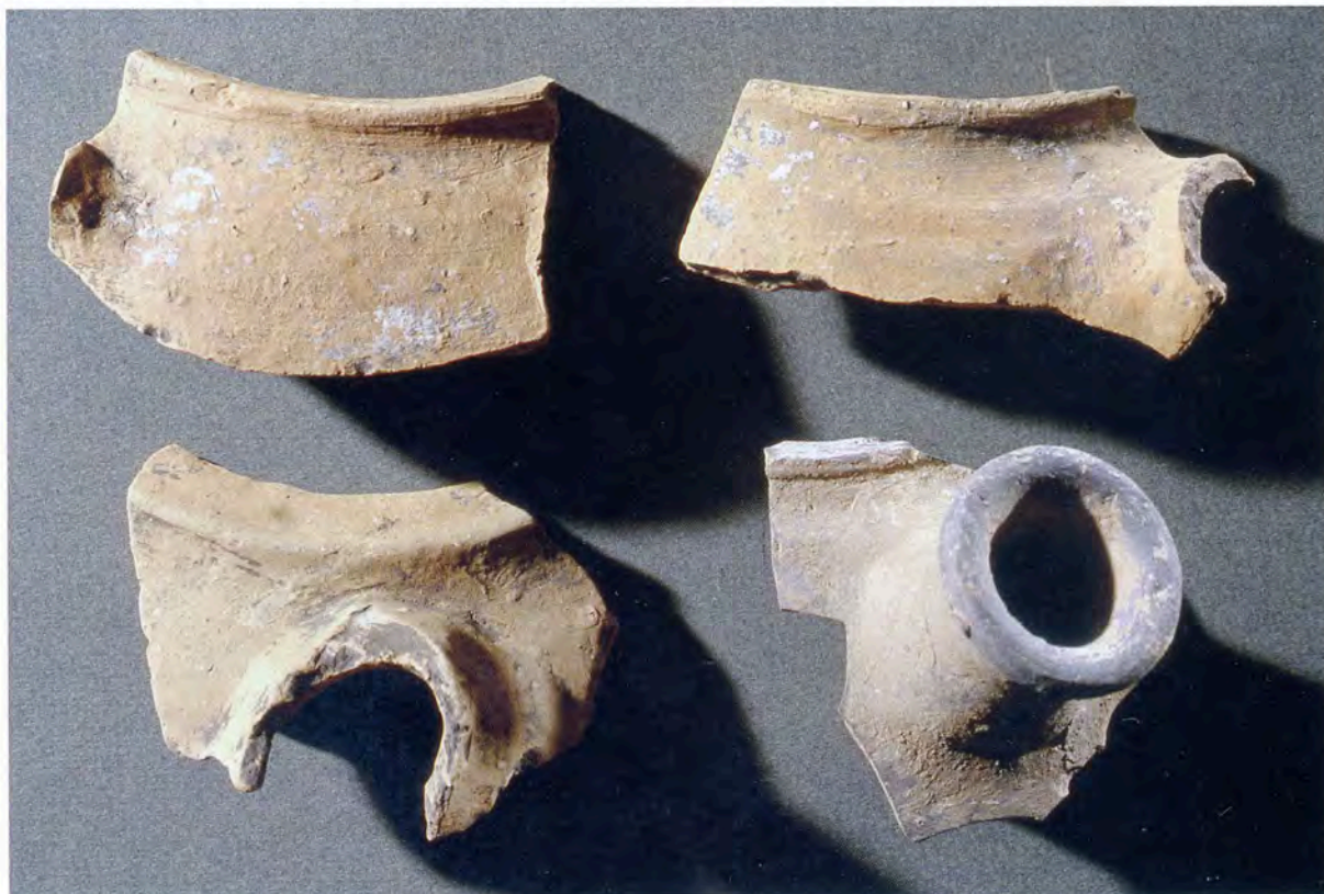
Fig. 20 Pot en pâte beige sableuse. H. conservée 11 cm, L. 19 cm. Montpellier, rue de la Fontaine-du-Pila. Lattes, Musée Henri Prades. Inv. 25824

Vallauri 2001, p. 90-96 ; Guionova, Vallauri 2011, p. 191-197). La fouille d'un quatrième atelier, hors de la porte de la Blanquerie, au bord du Verdanson, a livré également des céramiques médiévales en place ou remaniées dans un contexte de production de la fin du xv e siècle (Vallauri, Guionova 2008, p. 54-55). À cela s'ajoutent les sondages effectués lors du suivi des travaux du tramway et sur le site du Prêt gratuit (Thernot, Paone 2002, p. 74-81, fig. 133 ; Abel 2003, p. 18-21 ; Alessandri 2003, p. 37-41), au Musée Fabre (Bergeret 2004 ; Ginouvez 2004), rue de la Providence (Henry 2009) ou encore les travaux récents du complexe médiéval de la rue de la Barralerie (Markiewicz 2011) et dans le faubourg de la Saunerie les