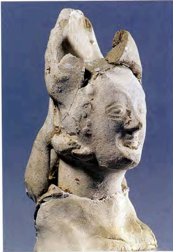
Fig. 16 Jarre en pâte grise. H. conservée 62 cm. Aniane, monastère Saint-Benoît. Dépôt archéologique Vendémian

pourrait appartenir à une statuette féminine ou religieuse (fig. 15). Ce visage au long nez fin et au sourire précieux est à rapprocher des fragments de statuettes plus rustiques en argile réfractaire ou calcaire retrouvées à Avignon ( Le Vert et le Brun 1995, n° 281, p. 296, 297).