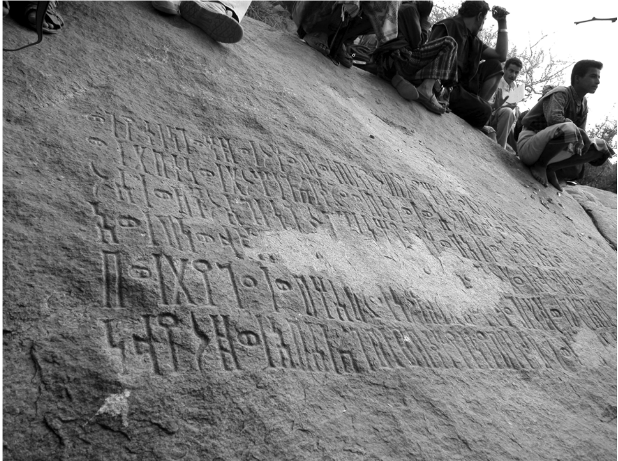
Inscription de fondation du barrage du Wādī Ḥisāya (© Mission française dans l'antique royaume de Qatabân).