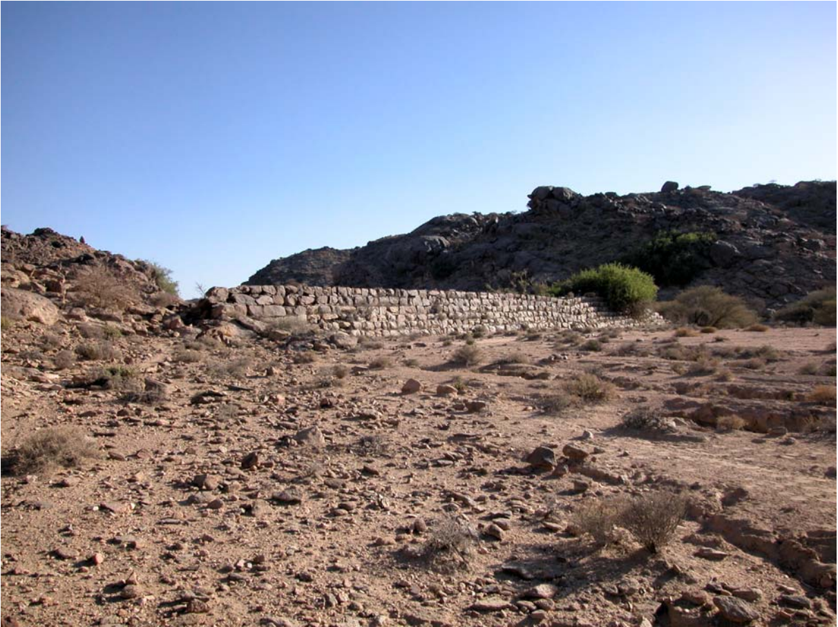
Le barrage-seuil du wādī Ḥisāya, façade en aval.