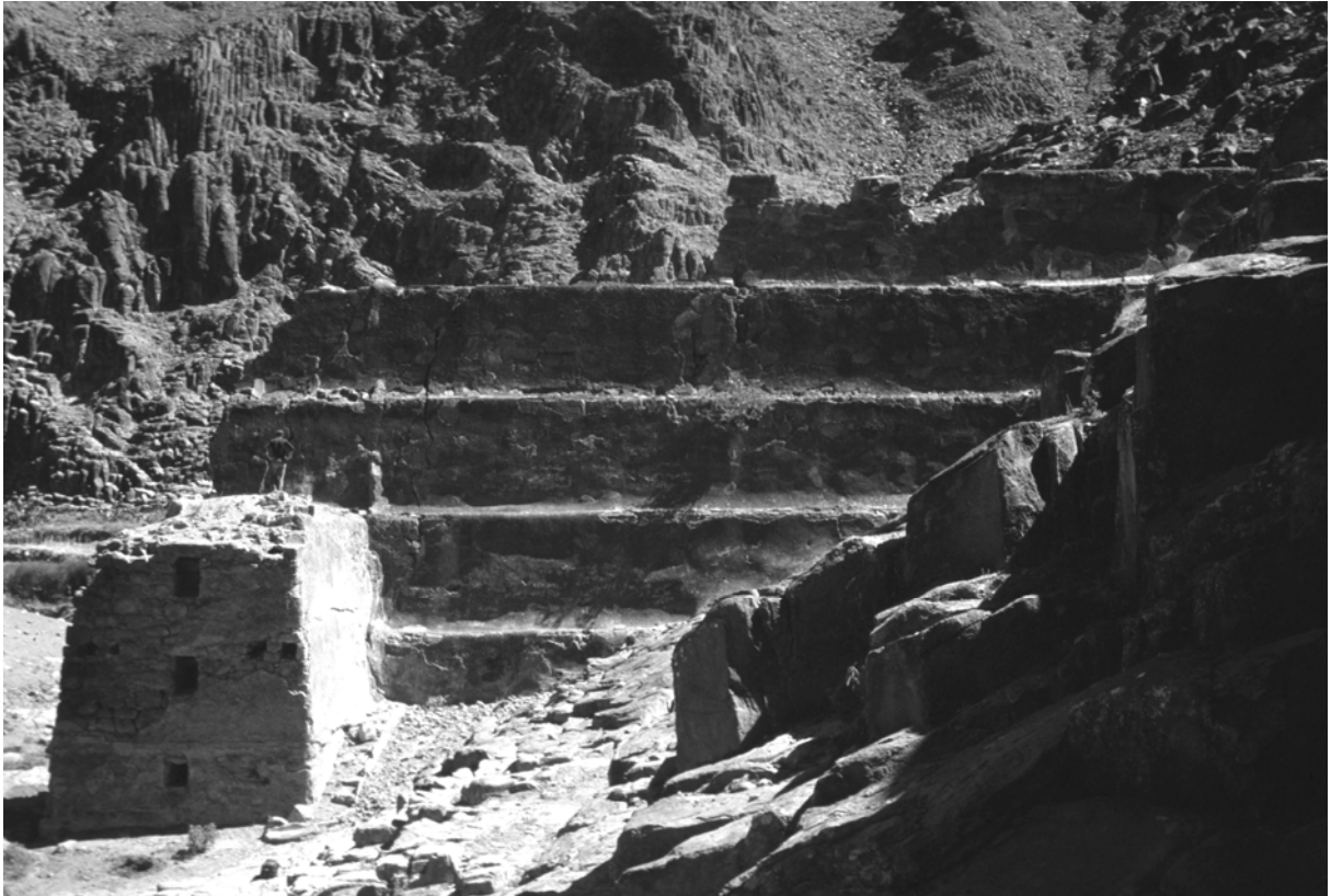
Le barrage de retenue de Sadd al-Dhira'a, façade en amont (© Ch. Robin).