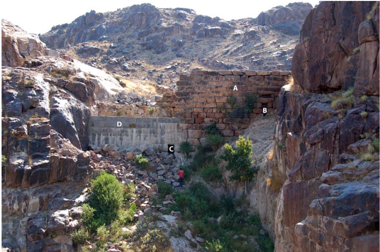
Façade aval du barrage supérieur du wādī dhū al-Qayl : (A) parement antique, (B) exutoire, (C) dispositif de vidange, (D) restauration moderne.