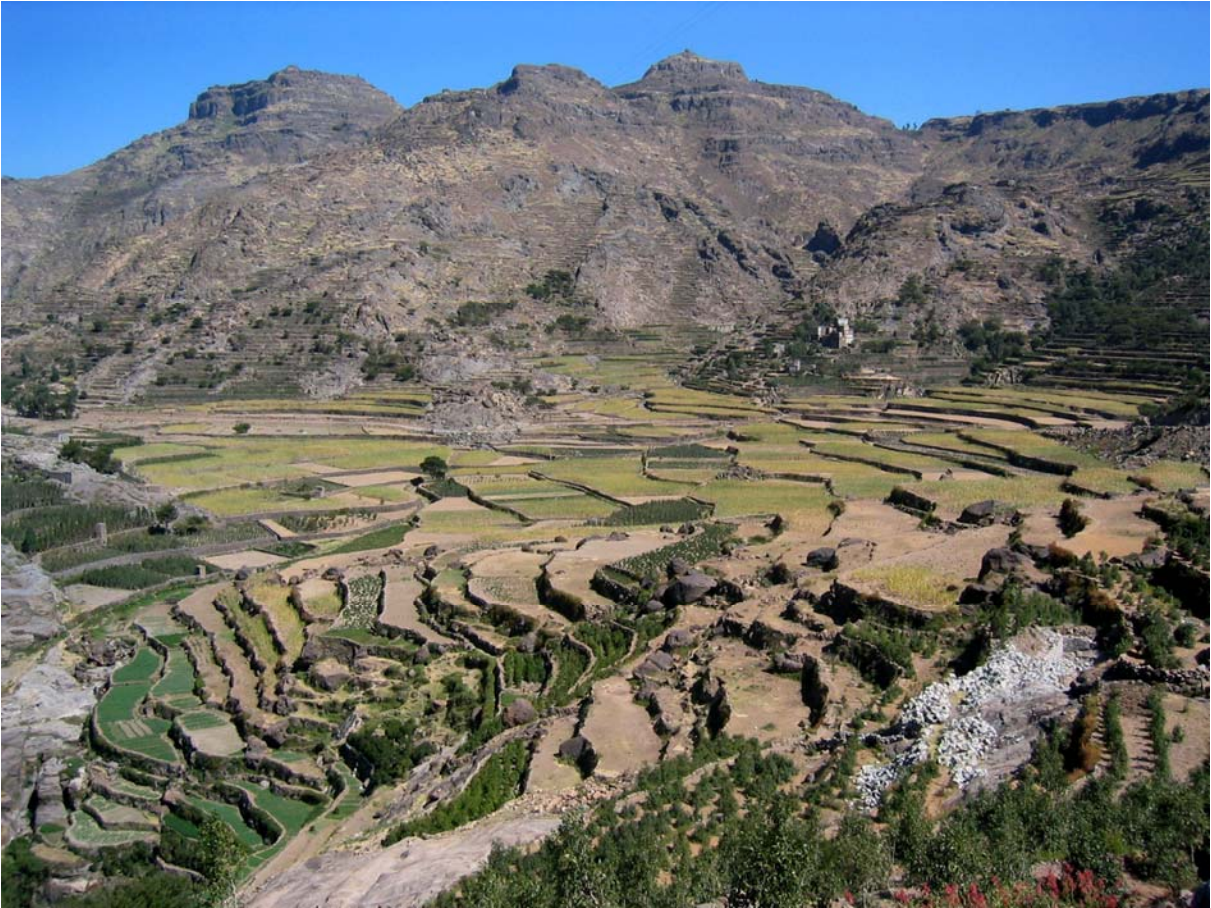
Paysage de terrasses agricoles sur les hautes-terres du Yémen.