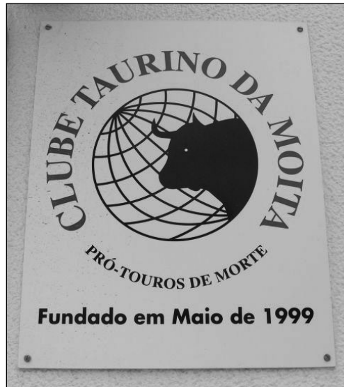
Fig. 3. — Siège du club taurin de Moita. Panneau revendiquant l'attachement à la corrida intégrale.

Aujourd'hui, dans un tout autre contexte, de nombreux aficionados portugais militent en faveur de la légalisation des corridas « intégrales » à l'espagnole dans leur pays. Pour eux, l'autorisation de la mise à mort entraînerait un développement rapide de la tauromachie à pied, considérée comme constitutive du patrimoine portugais. Autrement dit, une partie de l' afición portugaise, issue en particulier de la bourgeoisie de Lisbonne, de Vila Franca de Xira et de Moita, développe un discours transnational d'intégration des espaces tauromachiques espagnols et portugais en vue de combler un sous-développement taurin dont la législation est tenue pour responsable (fig. 3).