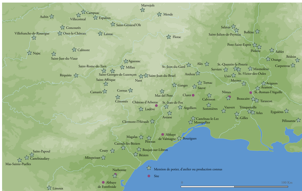
Fig. 1 : Principaux ateliers de potiers connus par les textes et/ou l'archéologie, Xe-XX e siècle (DAO L. Maggiori, LA3M)

Montpellier, 800 livres en 1067 quintaux et 67 livres de miel des Corbières « de ducentis quinquaginta quinque carratellis mellum et ducentis jarris mellum » 2 qu'ils porteront en Sicile, à Rhodes, à Alexandrie sur un vaisseau d'Aigues-Mortes nommé Sainte-Eulalie, en échange de poivre, de gingembre et de cannelle.