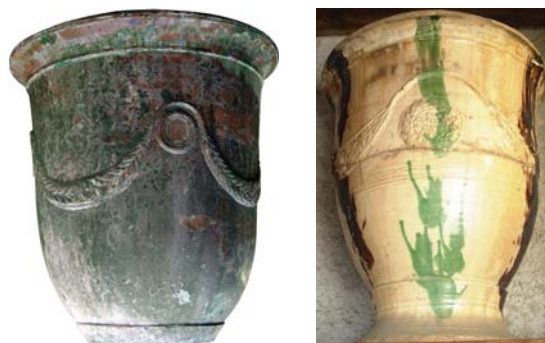
Fig. 19, 20 : (19) Clauzel A Tornac Gard, Coll. part. ; (20) Jean Favier à St.-Jean-du-Gard, Musée des Vallées Cévenoles

Un tel succès ne pouvait que générer des imitations plus ou moins réussies. C'est ainsi que d'autres fabriques produisent des vases de même type et en particulier non