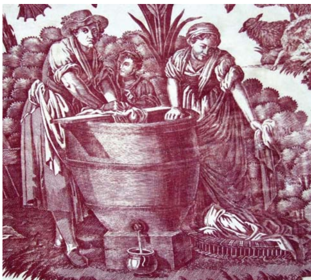
Fig. 8 : Toile imprimée XVIII e siècle. coll. part.