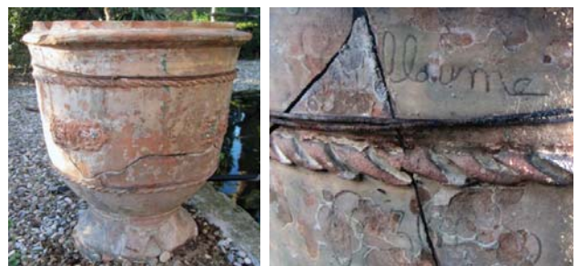
Fig. 24a, 24b : « Guillaume Pézenas », Coll. part.