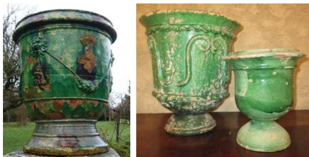
Fig. 11, 12 : Languedoc ?, deuxième moitié XVII e siècle. Coll. part. ; Saint-Jean-de-Fos, coll. part.

Les jardins de quelques grands de ce monde, s'adornaient donc de grands vases plantés, dont certains, à Montpellier en tout cas, et selon Xavier Azéma, portaient une étrange dénomination faisant référence à un Orient, aussi extrême que hors de propos, en cette matière plus nettement méditerranéenne (Azéma 2004 : 64-65). Ainsi écrit-il, « les vases d'orangers étaient souvent nommés grands orangers chinois, petits orangers chinois » suivant leur taille 61 .