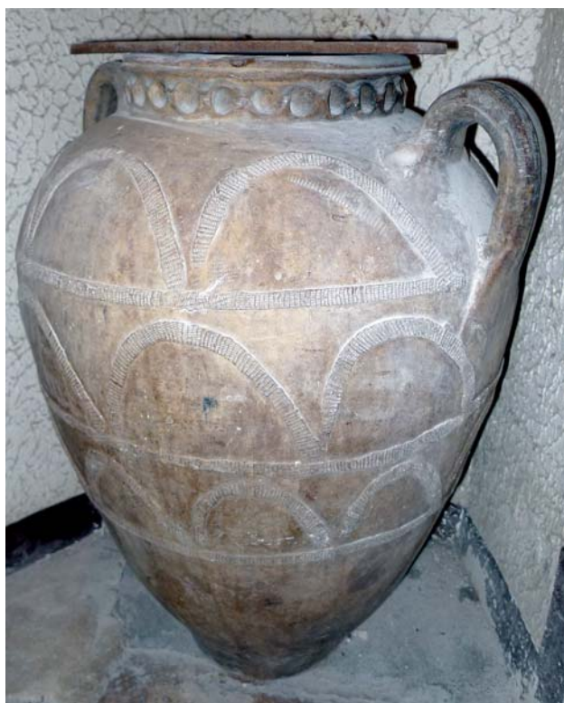
Fig. 4 : Languedoc, XVIII e siècle ? Coll. part. (Cl. Y. Comte)

Il est enfin tentant d'attribuer à l'aire montpelliéraine, mais sans doute à une époque plus récente, d'autres jarres en pâte claire plus élancées, dont l'ornementation s'organise sur deux registres, composés des mêmes cordons d'appliques imprimés à la molette (Amouric, Vallauri 2005 : 104, 105). Une jarre patrimoniale, tout aussi archaïsante est dans un cas décorée d'arceaux sur trois registres avec un cordon digité renforçant l'ouverture (fig. 4).