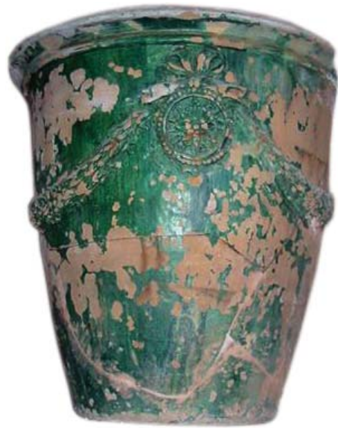
Fig. 23 : Pepet à Pézenas, Coll. part.