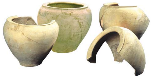
Fig. 3 : Jarres à verdet, Montpellier, XVII e siècle. H. 33,5 cm.

Au début du XVII e siècle, ils sont encore fabriqués à Montpellier, au faubourg du Pila-Saint-Gély, dans les