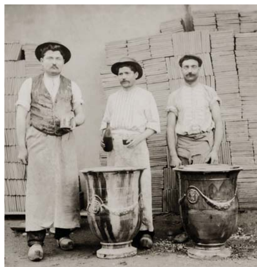
Fig. 18 : Potiers de la fabrique Trouvat à Anduze (début XX e siècle)

de jardin, de parc, à cette nuance près qu'il s'agissait autrefois d'abord de l'aristocratie laïque ou religieuse et qu'au XIX e siècle il s'agit désormais surtout de bourgeois enrichis, propriétaires terriens ou industriels ayant fait fortune sous l'Empire et la Restauration.