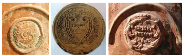
Fig. 15-17 : L Boisset, Coll. part. ; moule Boisset à Anduze, 1832, Musée du Vieux Nîmes ; « Boisset Rodier A Anduze », Coll. part.