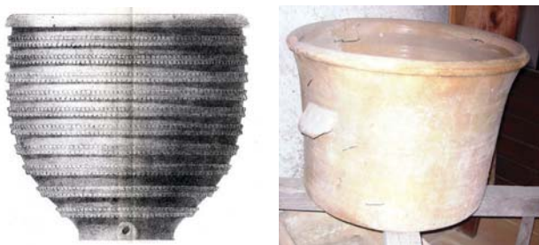
Fig. 9, 10 : Thuir, fabrique M. Marco, Musée de Sèvres ; Musée de Saint-Jean-du-Gard

grandes tailles. C'est sans doute l'exotisme recherché de l'oranger qui a très tôt suscité, chez les seigneurs méridionaux, languedociens et provençaux, l'envie de posséder cet arbuste à la fleur parfumée et au fruit sucré. Les premières mentions d'orangers plantés dans les jardins languedociens se trouvent d'ailleurs associées au XVI e siècle au nom du Connétable Henri 1 er de Montmorency. Afin de protéger les agrumes, l'usage s'établit de les planter dans des vases de terre ou des caisses de bois, mises à l'abri durant la mauvaise saison.