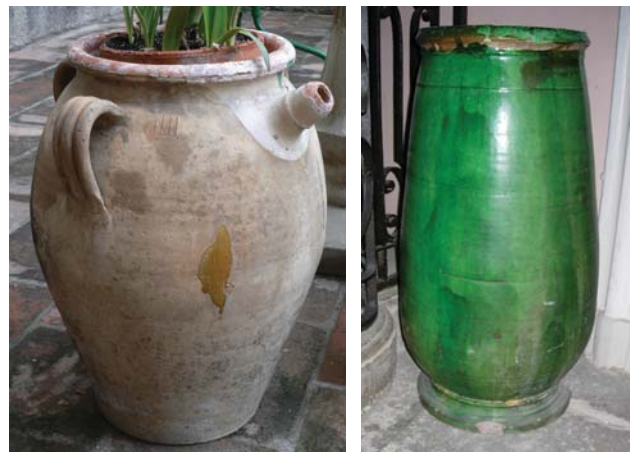
Fig. 6, 7 : (6) Meynes, XIX e siècle. Coll. part. ; (7) Tornac, XIX e siècle. Avignon, Musée Palais du Roure

Les grands vases de Tornac et Anduze, dont la plupart renvoient à la production du XIX e s., se distinguent par leur profil exceptionnel sub-cylindrique sur petit pied et leur belle couverte de glaçure verte à l'extérieur et brun jaune à l'intérieur. De diverses tailles, variant entre 40 et 95 cm de haut, ils ont servi à contenir l'huile et portent, comme les jarres de Meynes, des incisions de contenance. Celles-ci, gravées sur la lèvre après cuisson, sont plus ou moins nombreuses selon le volume, entre quatre et vingt-trois sur les exemplaires patrimoniaux observés (fig. 7). Des jarrons globulaires à deux anses, recouverts de glaçure verte à l'extérieur et brune à l'intérieur, sortis des mêmes ateliers, portent eux aussi deux ou quatre incisions sur le bord du col (Amouric, Vallauri 2005 : 114, 115).