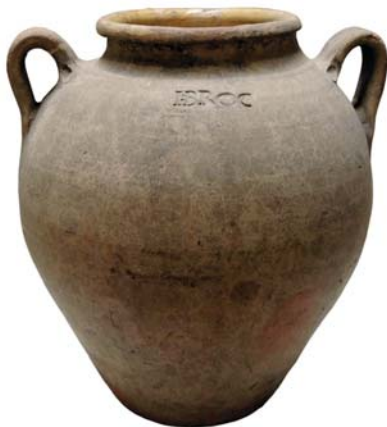
Fig. 5 : Ganges, timbre Jean Broc, 1 re moitié XVIII e siècle. Coll. part.

Enfin, c'est à Ganges assurément que le potier Jean Broc a timbré à son nom, « I. BROC », une grande jarre globulaire à deux anses. Cette pièce, plus tardive, remonte, dans le meilleur des cas, à la première moitié du XVIII e siècle (fig. 5).