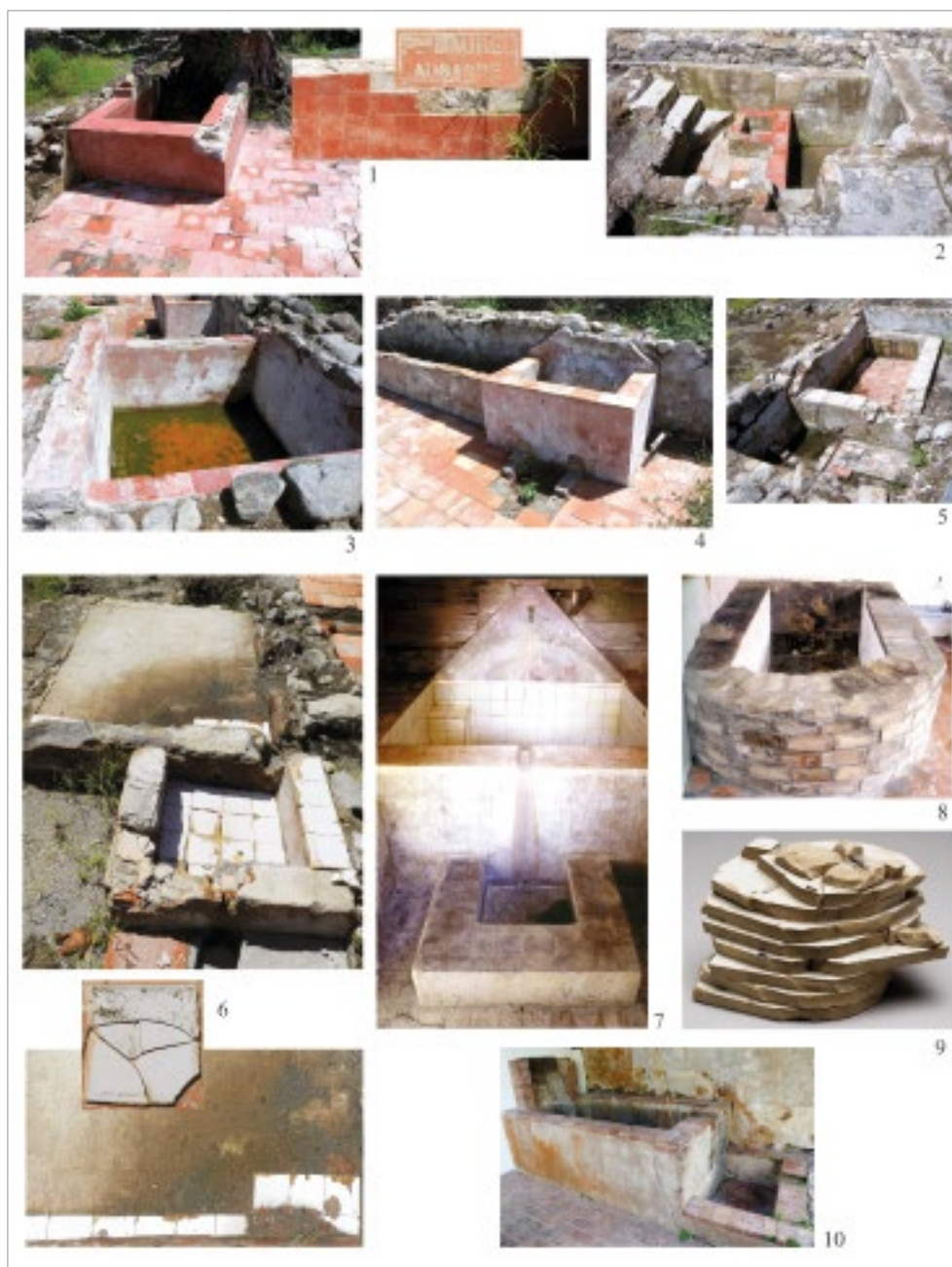
fig. 6 – nn. 1-6, chambres à bain en carreaux de Provence, Allée Pécoul, St-Pierre, fouille EVEHA 2014; nn. 7-8, 10, baigns dans habitations privées, Martinique (FLOHIC 2012); n. 9, pile de carreaux émaillés, Musée de St-Pierre.

pratiquait l'hydrothérapie, les cuvettes latrines en terre vernissée provençale, très en avance sur leur temps (fig. 4, nn. 8-9).