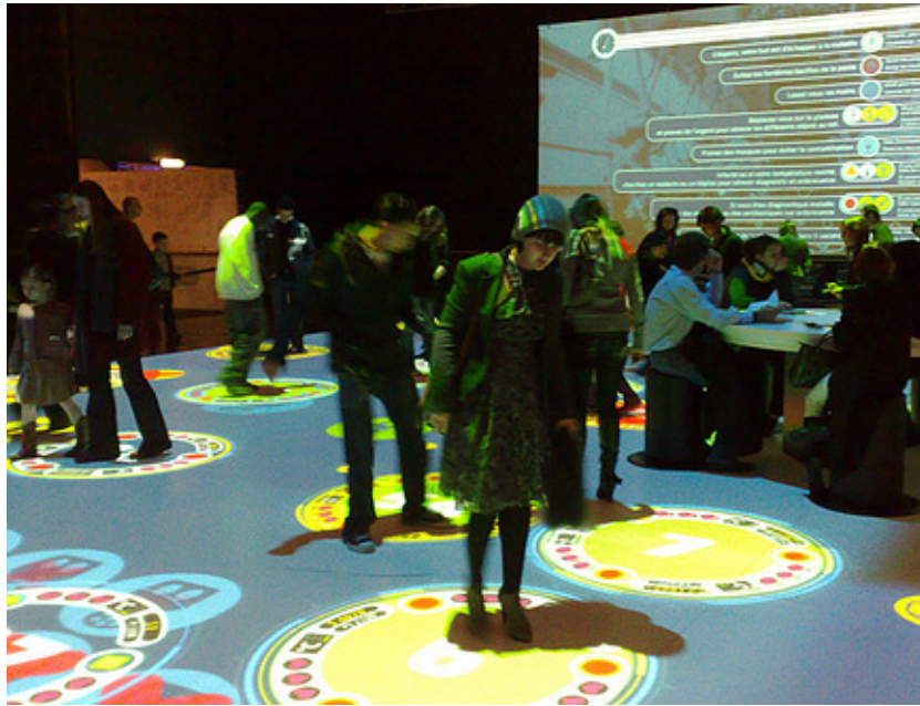
Figure 2 : le visiteur spectacularisé dans l'exposition Epidemik à Universcience, creditCopyright © 2009 Laforme New Media.