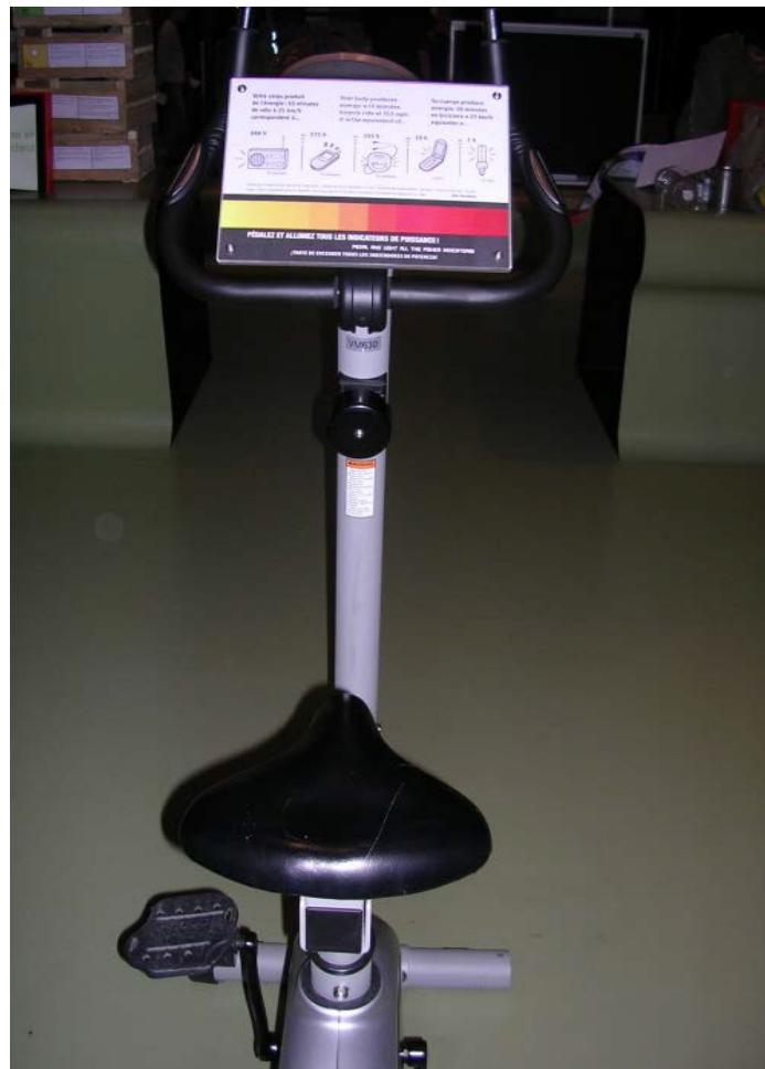
Figure 1 : Vélo pour observer l'énergie produite en pédalant dix minutes à 25 km/h dans l'exposition Changer d'ère, CSI, 2007, photo Anne Gagnebien, CSI tous droits réservés.