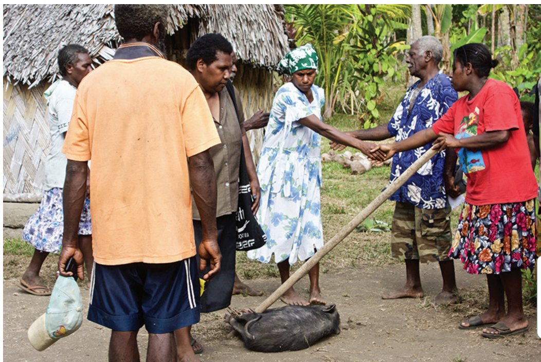
A Malekula, île du Vanuatu, les dispositifs de conciliation des disputes sont hautement formalisés. Ils incluent des discours qui exposent les raisons antagonistes et expriment les modalités de culpabilité et de résolution, échange de cochons et serrages de mains à l'appui. Par l'élicitation des attentes des uns et des autres, des malentendus et des modalités de résolution des conflits, ils mettent en scène des hiérarchies de valeur et atténuent ainsi les incertitudes provoquées par les conflits.

il était assis sur un arbre sous la forme d'un enfant-esprit attendant une mère pour y animer ce qu'il allait devenir lui-même plus tard. Loin de se limiter à la seule étude des terminologies, des règles de mariage et des principes de filiation et de descendance, comprendre la parenté, c'est interroger les principes qui, ici et là, construisent les personnes. Ces constructions, nous l'avons vu, n'ont à voir avec la procréation en tant que fait biologique que de manière subalterne.