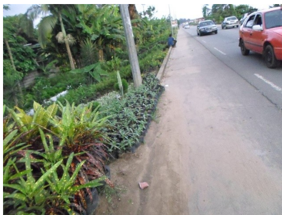
Photo 1 : Un site d'horticulture situé en bordure du boulevard de France sur l'axe Heden Golf Hôtel-Sol-Béni. (Cliché de l'auteur, juin 2014)

respectivement celles de Cocody et du Golf . Pour ce qui est de la situation des sites relativement à la proximité des voies routières, il a été observé qu'ils se localisent majoritairement à moins de 5 m de la chaussée et ce, en partant des accotements aux emprises de la voirie tout en passant par des trottoirs. Dans le cadre de cette étude, les voies identifiées sont les boulevards Mitterrand, des martyrs, de France jusqu'au carrefour de « Sol-béni ». La spécificité commune de tous ces sites est leur proximité des infrastructures routières intensément fréquentées (Photo 1).