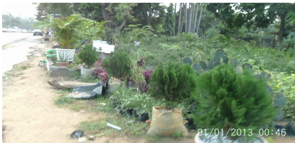
Photo 2 : Un paysage d'activités horticoles le long du boulevard Mitterrand aux environs du carrefour dit « de la vie ». Paysage contribuant à l'embellissement de l'environnement immédiat. (Cliché de l'auteur, juin 2014).

Parmi ces horticulteurs interrogés 58% disent avoir un revenu hebdomadaire de moins de 100.000 FCFA, 32% estiment que leur revenu sur la même période est variable et 10% avouent avoir des revenus compris entre 100.000 et 500.000 FCFA. En plus de ce qui précède, l'horticulture en milieu urbain concoure à l'embellissement du cadre environnant (Photo 2).