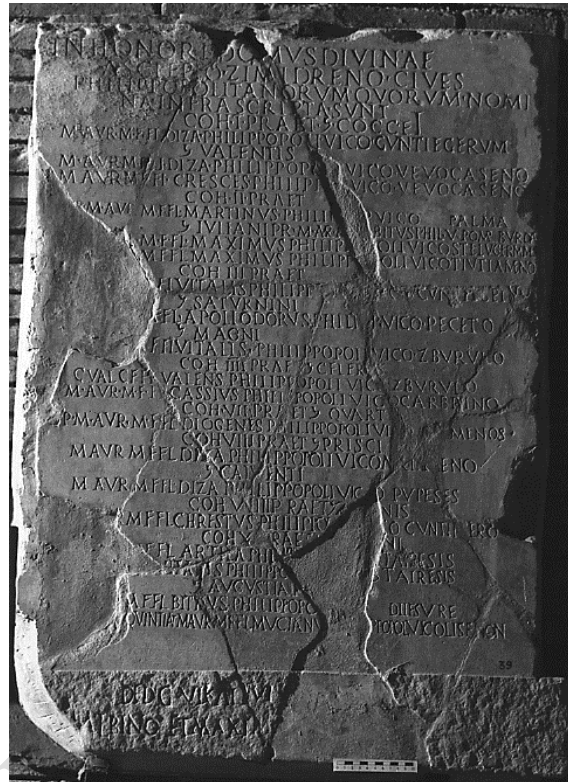
Fig. 3. CIL VI 2799 = 32543 . Roma, Musei Capitolini

trasposizione dal greco, l' Aesculapius Sindrinae reg(ionis) Philippopolitanae rappresenta la variante latina, con la forma aggettivale contratta del toponimo (* Sindra/Zindra ). Come nello spazio trace un santuario attira fedeli da tutta la regione, anche da lontano, così sull'Esquilino i pretoriani traci sembrano associarsi intorno a una divinità regionale. Sia Apollo che Esculapio sono entrambe divinità guaritrici 97 , anche se la personalità divina del primo è certamente più complessa (vedi infra ).