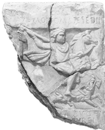
Fig. 1. CIL VI 32566 [fr. a+b]. Roma, Musei Capitolini (© Archivio Fotografico, NCE 563)

Ci concentreremo ora su un consistente gruppo di dediche sacre (iscrizioni e/o rilievi votivi), rinvenuto negli anni Settanta dell'Ottocento, tra i Castra Praetoria e le terme di Diocleziano, e tra piazza Santa Maria Maggiore e via Napoleone III, e soprattutto nella piazza Manfredo Fanti. Si tratta di iscrizioni e/o rilievi votivi, originariamente collocati presso i castra praetoria e reimpiegati in età post-constantiniana 60 , dedicati a divinità indigene o assimilate al pantheon greco-romano 61 . La presenza di questo nutrito gruppo di dediche in prossimità del più grande accampamento della città mostra come non ci fosse alcuna incompatibilità tra culti indigeni e manifestazione di lealismo verso il potere imperiale 62 .