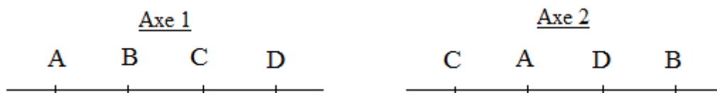
Graphique 1 : Deux exemples de classement des candidats A, B, C et D

En revanche, le deuxième axe proposé, \{C - A - D - B\} , est parfaitement cohérent avec les choix des électeurs, puisque, quel que soit le bulletin considéré, aucun candidat non approuvé ne vient jamais s'interposer entre deux candidats approuvés. Dans notre exemple, cet axe traduit donc de façon satisfaisante la vision des proximités politiques qui est celle des électeurs eux-mêmes, puisque les trois bulletins proposés sont strictement unimodaux sur cet axe. Il en serait évidemment de même de l'axe exactement symétrique \{B - D - A - C\} qui lui est équivalent.