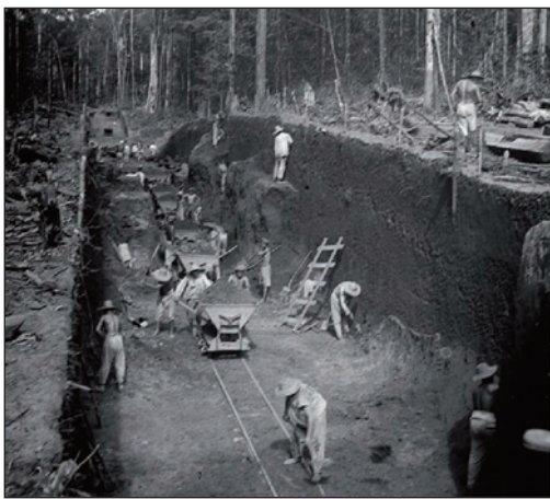
Construction de la ligne de chemin de fer

Mais si la relégation ne s'applique plus en Guyane, elle est toutefois maintenue sur le sol de la métropole. Du fait du Second Conflit mondial, un dernier convoi de relégués en direction de la Guyane est organisé en décembre 1938 et les relégués maintenus en France métropolitaine subissent dorénavant leur peine dans un établissement ou un quartier de prison spécialement aménagé 19 . La loi sur l'exécution de la peine de la relégation dans la métropole et sur l'élargissement conditionnel des relégués transportés du 6 juillet 1942 astreint les relégués au travail forcé et à une période d'observation de trois ans. À l'issue de cette période, s'ils sont reconnus aptes, ils peuvent bénéficier d'une libération conditionnelle qui ne peut devenir définitive qu'au bout de 20 ans. La relégation n'est officiellement abolie qu'avec la loi tendant à renforcer la garantie des droits individuels des citoyens du 17 juillet 1970. Mais dans les faits, elle est simplement remplacée par une tutelle pénale des multirécidivistes 20 . Cette tutelle n'est abolie à son tour qu'avec la loi renforçant la sécurité et protégeant la liberté des personnes du 2 février 1981.