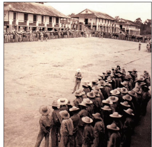
Appel des relégués