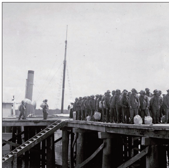
Arrivé à Saint-Laurent